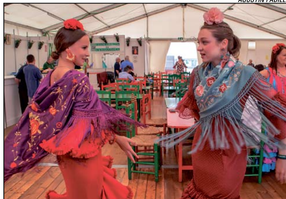
Fotografia ganadora del concurs del any passat en la categoria de Feria de Abril.