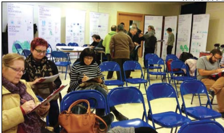
Diversos ciutadans, participant al procés participatiu sobre el Pla de Mobilitat Urbana i Sostenible.