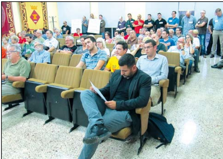
La ciutadania va omplir la sala de plens al ple d'ahir a la tarda.

Menchu Martí, de PxC, va tornar a encendre els ànims de la sala amb les seves afirmacions sobre Lluís Companys i alguns components de l'ANC, va criticar la manipulació de TV3 i la utilització del cens electoral. Per acabar, va