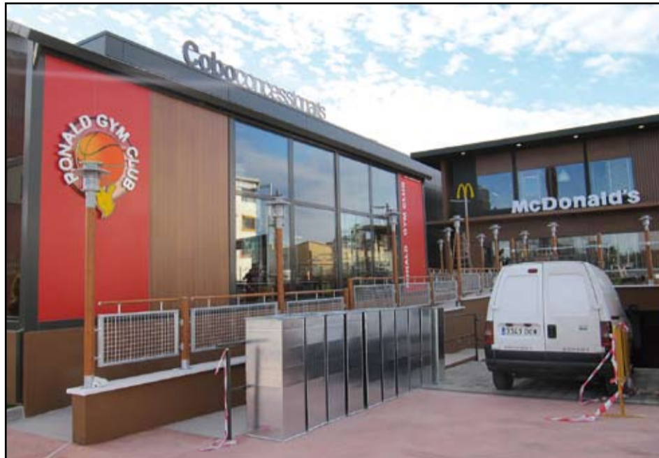
El nou restaurant de McDonald's està ubicat al davant del MhiC, al costat de l'arc.

El nou restaurant té una superfície interior de 500 m 2 i capacitat per a més de 170 persones, així com una gran terrassa que pot albergar més de 100 clients. Es tracta d'un restaurant tipus xalet de dues plan-