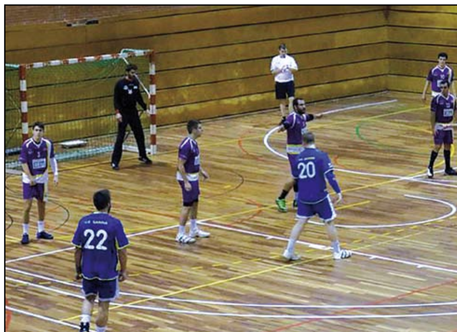
Un moment del partit entre el Sarrià i el Sant Martí Adrianenc.