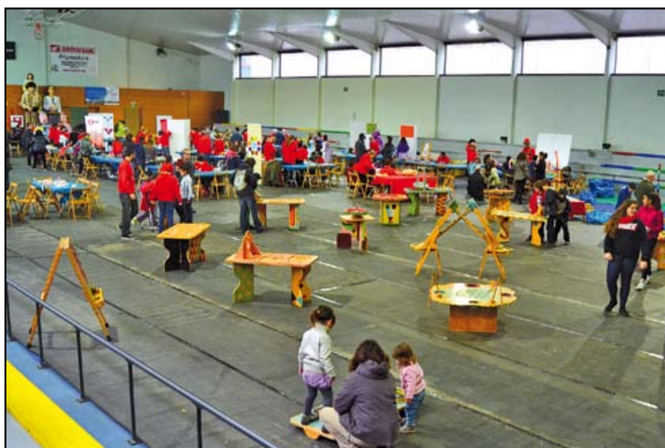
Els infants van ser els principals protagonistes de l'Adrilàndia.