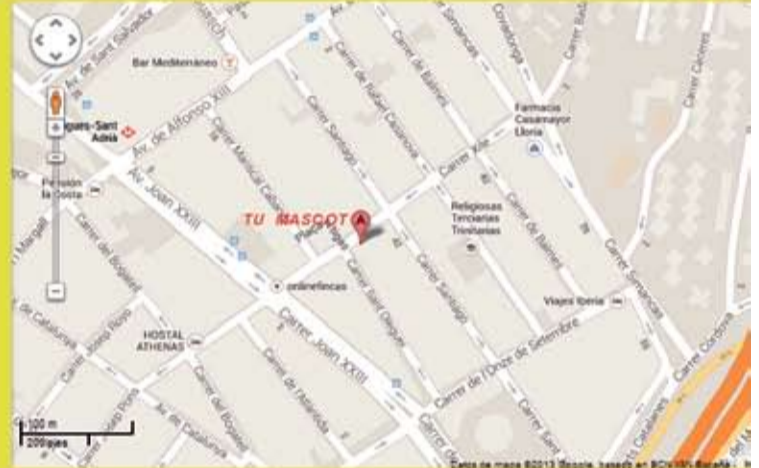
Perros-gatos (por encargo)

c. Andreu Soler, 18 (cantonada Sant Oleguer) 08930. Sant Adrià de Besòs (BCN); Tel/fax 93 383 47 99 www.tumascota.cat info@tumascota.cat