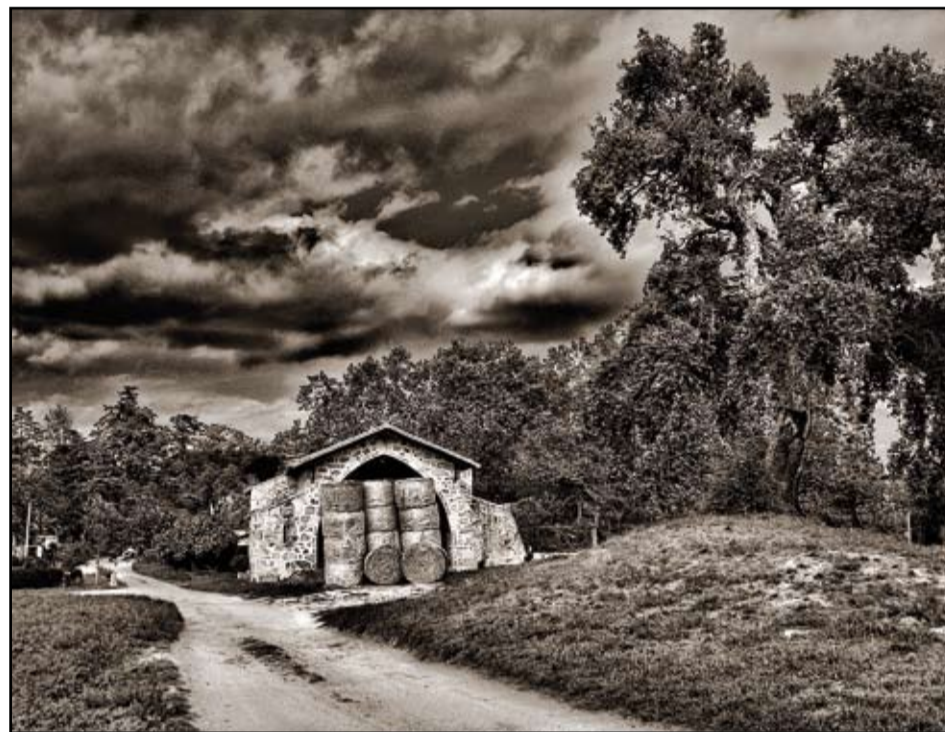
Una de les fotografies de Luís Aracil que es pot veure a l'exposició de l'Agrupació Fotogràfica.