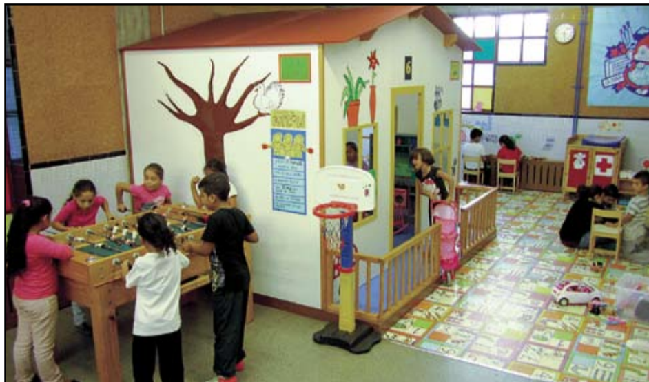
CASAL INFANTIL LA MINA

L'artista, després de conèixer el programes socioeducatius que des-