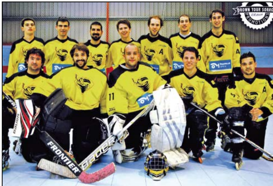
Bon paper del "Tucans-Asme Muralla Òptica a la Lliga Nacional Plata d'Hoquei.

El primer partit es va guanyar contra l'equip d'Hoquei Línia Igualada. Aquest partit es presentava a priori en total desavantatge per als nostres