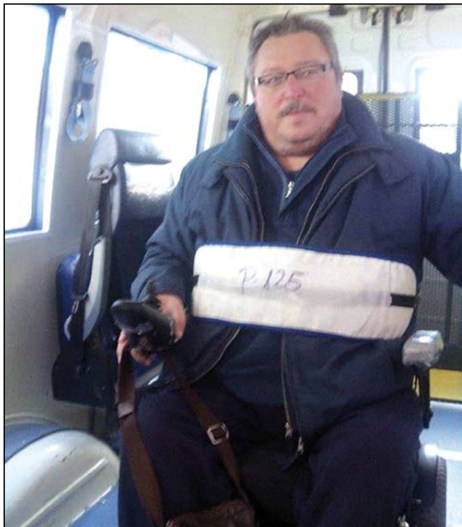
Així han d'anar els usuaris del servei de taxi adaptat des de finals de l'any passat.