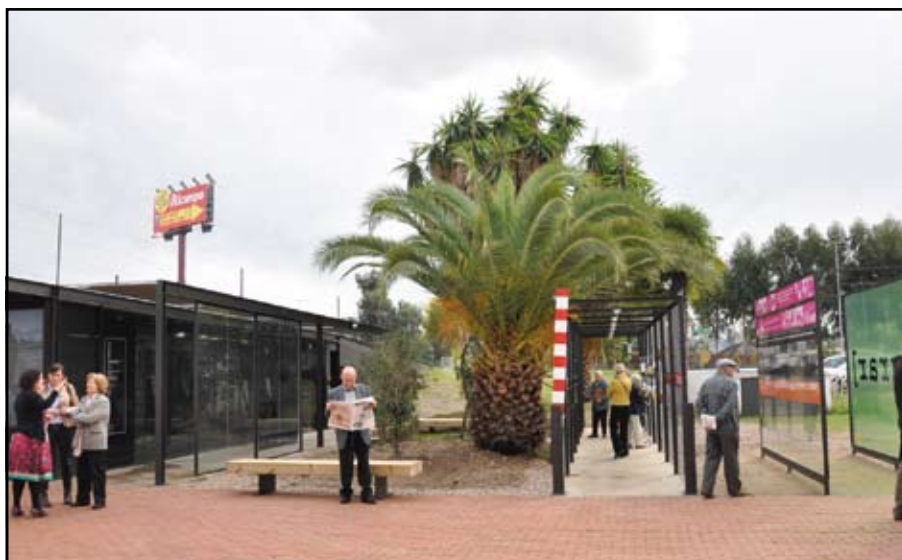
El nou “Espai Migrar” al MhiC, inaugurat el 5 de novembre al MhiC.

El passat 5 de novembre es va inaugurar una nova exposició permanent al museu d'Història de la Immigració de Catalunya (MhiC), que porta com a títol “Espai Migrar”. Juntament amb el vagó de tren de “El Sevillano” i la Masia Can Serra, es forma a Sant Adrià un nou espai museogràfic vinculat a les migracions que tant a la dècada dels 60 com actualment estan tenint lloc a la ciutat. Al seu torn, es va presentar la peça tàctil de la reproducció del vagó “El Sevillano”, una magnífica maqueta de bronze que passarà a formar part del fons del museu i que ha estat a