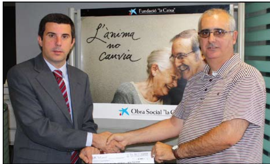
L'Obra Social de La Caixa col·labora amb l'Associació d'Hoquei Línia Tucans.

Amb una contribució perquè l'entitat continui la seva labor esportiva i social.