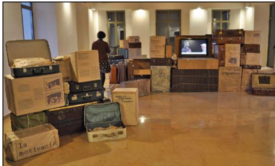
L'exposició “Diàlegs Migrants” es pot visitar al MhiC fins el 24 de novembre.

migracions en dues èpoques i en circumstàncies diferents fa d'aquesta exposició una interessant trobada de punts en comú pel que fa a les motivacions o les dificultats del col·lectiu immigrant.