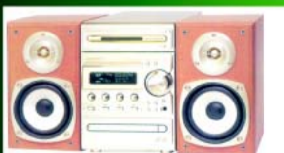
KENWOOD MICROCADENA HM-535 H

Som els primers a tenir la tecnologia més innovadora. Amb els dissenys més avantguardistes. A més, si ho trobes més barat et tornem la diferència. A Milar, ens agrada que ens posis a prova.