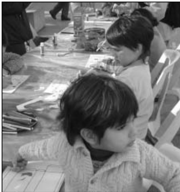
Els infants van ser els màxims protagonistes.