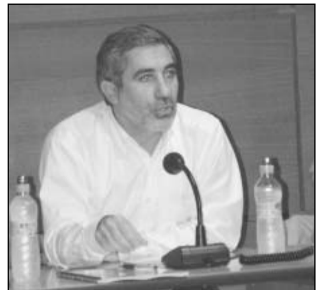
Gaspar Llamazares arremetió contra el gobierno de José María Aznar en su visita a la Biblioteca de Sant Adrià.

elogió el trabajo efectuado en dichas obras, aunque también afirmó que sólo había visto la cara positiva de éstas. Por la tarde se acercó hasta la Mina para conocer la parte negativa de esta reforma urbanística, de la que manifestó debe ser «integral». Más tarde realizó una conferencia en la Biblioteca de Sant Adrià en la que criticó la política social del gobierno popular de José María Aznar.