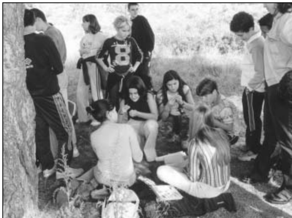
Alumnes de l'IES Ramon Berenguer IV fent repoblació forestal al Torrent de la Llevadora. IES.B.

Per saber més sobre el Programa d'Escoles Verdes: www.gencat.net/mediamb/ea/ev . Hi participen el Departament d'Ensenyament, el de Medi Ambient, l'Institut Català d'Energia i la Societat Catalana d'Educació Ambiental, a més dels 55 centres educatius que ja tenen el distintiu.