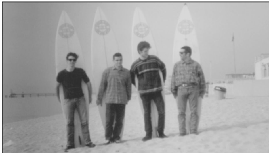
El grupo «Surfones» en la playa de Badalona (arriba). Abajo, «Cosmix».