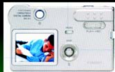
CASIO CAMARA DIGITAL CASIO EXILIM EX-S2