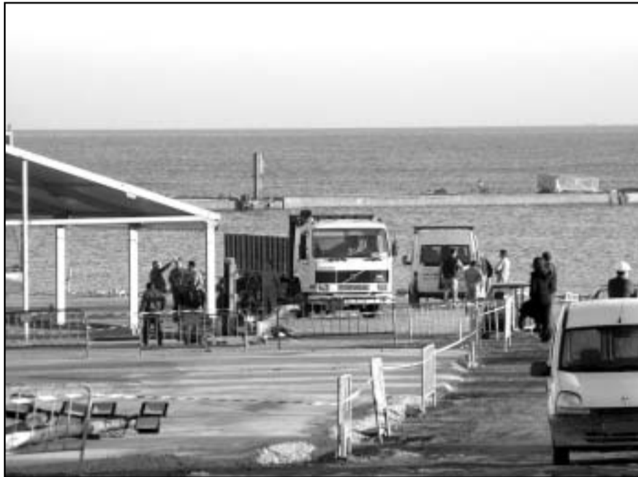
Las obras del puerto deportivo de Sant Adrià marchan a buen ritmo. Si todo va bien, el próximo año por estas fechas podría inaugurarse todo el complejo. J.P

El día 9 estaba previsto colocar el último de estos bloques, pero las condiciones del mar no lo permitieron. Clos restó importancia