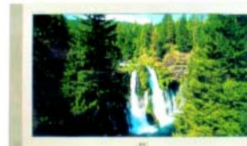
JVC TVC PANORÀMIC AV-26 T20 EPS 26"

Pantalla ampla Natural Flat. Sistema de so 3DSE. P+ Line. 2 años de garantia completa i 20 h. Ajustament de la temperatura del color. Resolució 1024x768. Mida (Amplada x Alçada) 740 x 509 x 499 mm. C53907