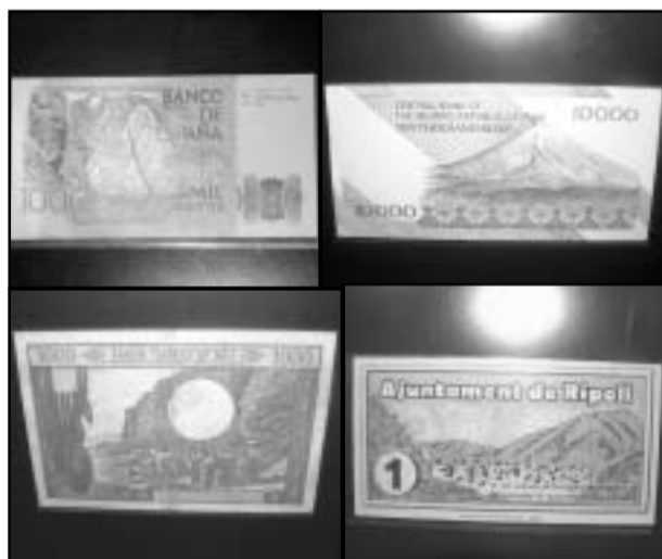
Una muestra de la colección de billetes de la exposición «Montañas de curso legal», con un billete de mil pesetas. M.S.

Y si lo que se quiere ver son rarezas, el último plafón de la exposición está dedicado a billetes expedidos durante la Guerra Civil de ciudades como Ripoll, Premià, Anoià o La Seu d'Urgell estampados con imágenes de Montserrat o del Cadí.