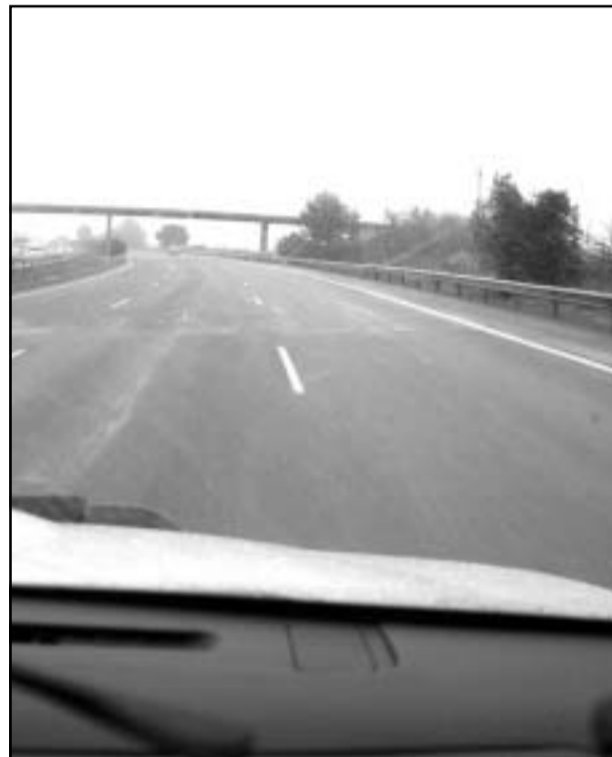
Les vies d'accés a les ciutats tenen un gran impacte.

espai, al marge de la dinàmica i l'estructura municipal, on abordar qüestions estratègiques del territori.