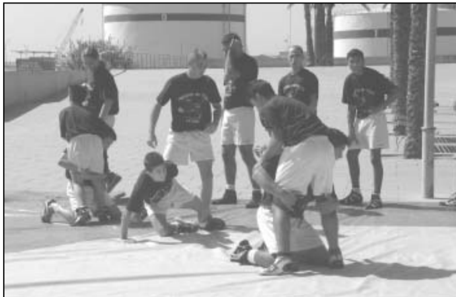
Los luchadores del C.L.L.O. la Mina, cada vez más fuertes en el panorama mundial. J.P

En el Torneo Internacional de Negrepelisse