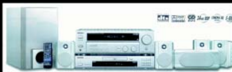
KENWOOD HOME CINEMA / AV-100DVD S

Si no ho troba a MILAR És que encara no existeix.