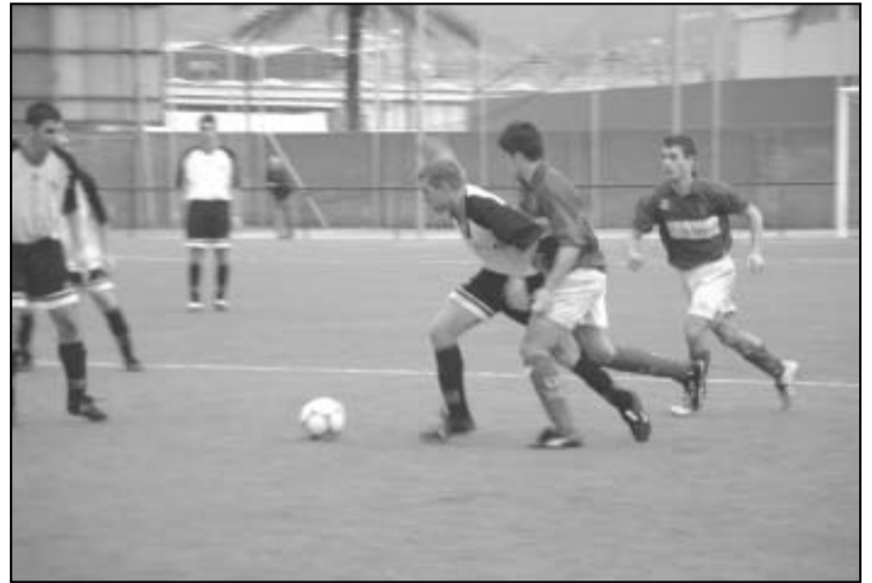
El equipo del Sangra en pleno partido la jornada pasada.

espera del partido que les enfrentará a un asequible Premià la próxima jornada de liga.