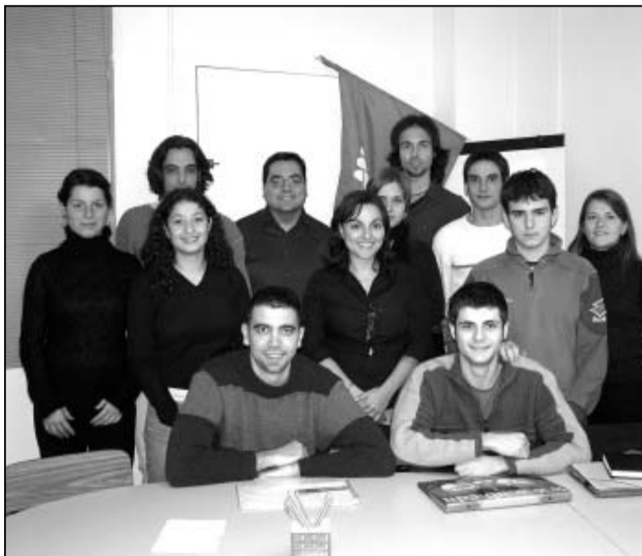
Fotografia de família de les noves Joventuts Socialistes de Sant Adrià.

Les Joventuts Socialistes de Sant Adrià comptaran aviat amb un espai propi a la seu del PSC del carrer Ricart, on es reuniran periòdicament. També tenen previst de fer una revista i una plana web pròpies però de moment aprofitaran tant la revista com la web del PSC com a mitjans de difusió.