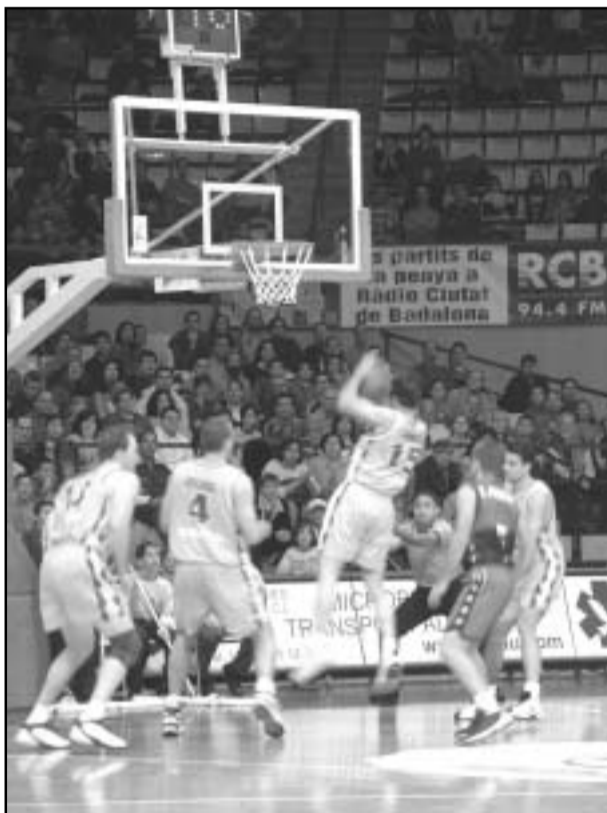
Los jugadores de la Peña deberán ponerse las pilas si quieren ir a la Copa del Rey. Otra vez los errores de siempre han mandado al equipo de Badalona a un puesto inesperado en la tabla. J.PATAS

Sin ningún tipo de duda, el calendario es otro de los hándicaps a los que se ha tenido que enfrentar el Joventut en este inicio de temporada. Pamesa, Estudiantes, Tau y Real Madrid han sido los visitantes del Olímpic, y la Peña ha perdido contra todos ellos, lo que hace que el Joventut sea el único equipo de la ACB que aún no conoce la victoria como local. Los cuatro son rivales de entidad, pero si la Peña quiere volver a ser uno de los grandes de la liga no debería conformarse con perder contra los que, en principio, jugaban la misma liga que ellos, aunque todo parece apuntar que de nuevo, esta temporada, la liga del Joventut será la que disputan el Breogán, el Aunacable, el Alicante y compañía: la de sufrir tanto como para estar entre los