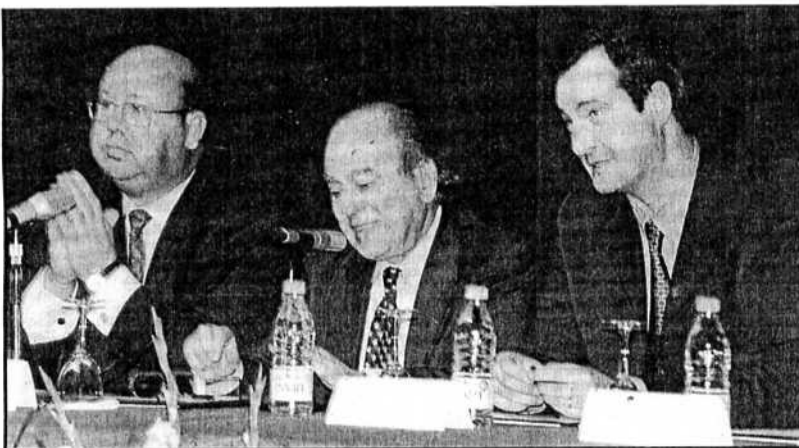
El presidente de la Generalitat, durante su visita al colegio de los gabrielistas.

el espectáculo en Sant Adrià, ambas sesiones tuvieron una entrada bastante buena. El actor, días antes de la presentación de su nuevo trabajo en Barcelona, se metió al público en el bolsillo. Página 15