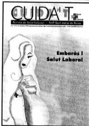
Portada del número cero de la revista "Cuida't" (original en color)

El doctor Subirana opina que "nuestro colectivo de trabajadores es muy profesional, pero es muy positivo informarlos de forma sistemática sobre temas relacionados con la salud laboral".