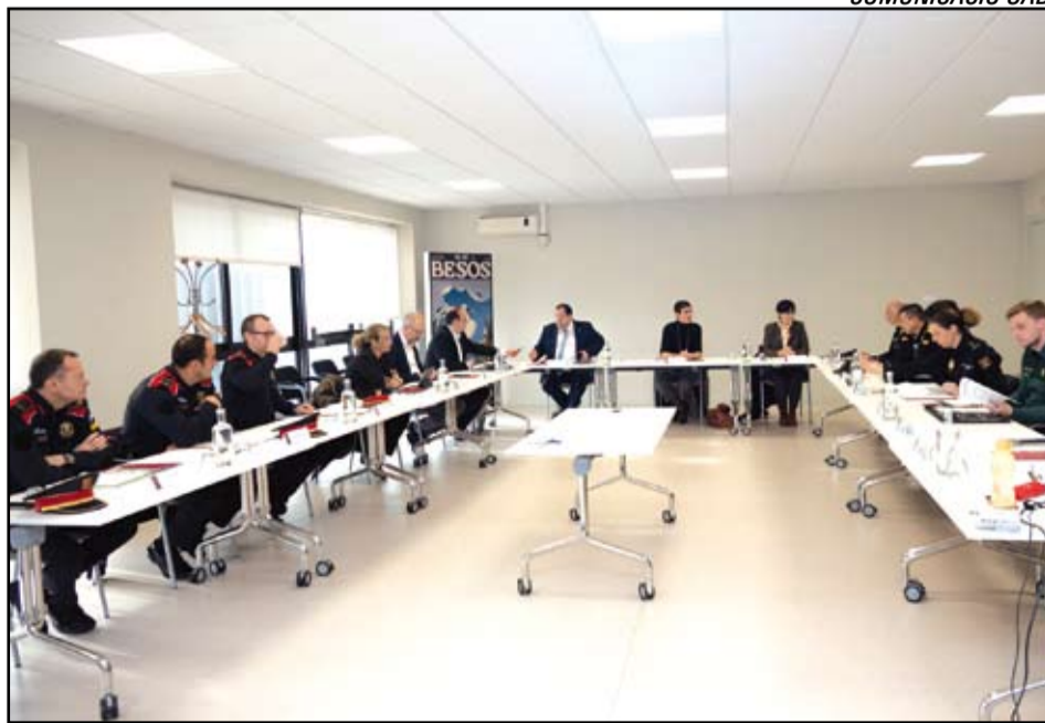
ENTESA PER UN GRAN PARC LITORAL BESÒS