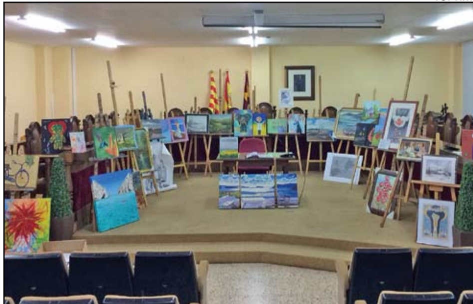
La sala d'actes de la Casa de la Vila va acollir la novena subhasta de TOT ART. Les obres que no es van vendre quedaran exposades a la botiga fins el dia de Reis.