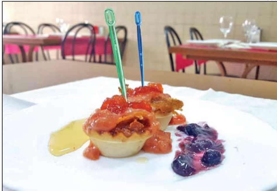
El Restaurant El Trasgu és un dels participants a la Ruta-Tapa de tardor a Sant Adrià.