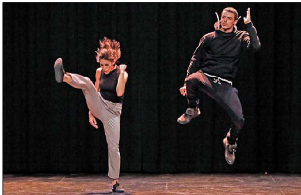
Aina&Arias presentarán "A to A" en la octava edición del Encuentro de danza y cultura urbana.