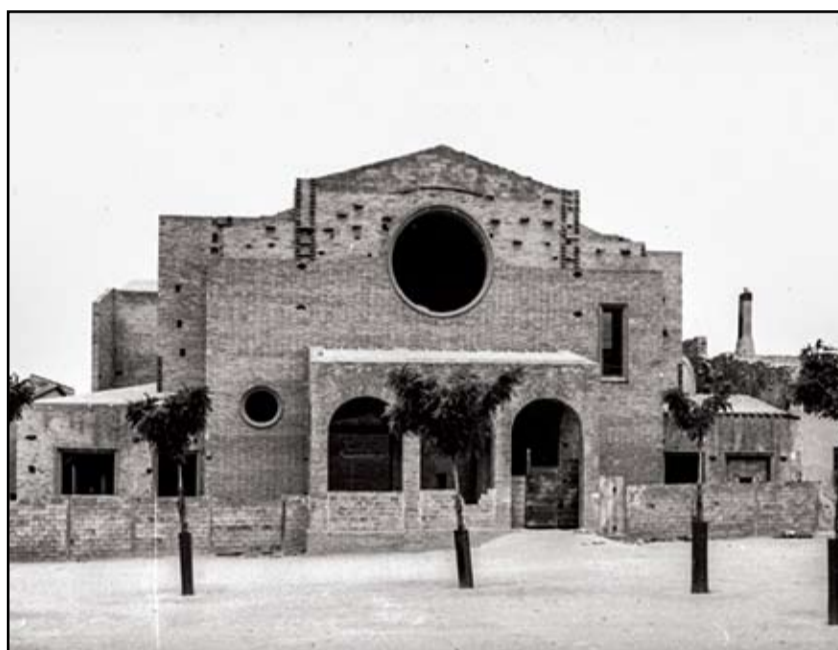
Construcció de l'Església de Sant Adrià.

Si disposeu de fotografies o negatius antics de Sant Adrià, us preguem ens els feu arribar a la nostra Agrupació. Farem ampliacions similars a aquestes que veureu, us les retornarem el més aviat possible i seran exposades durant la Festa Major de l'any vinent. Agrupació fotogràfica Sant Adrià de Besòs.