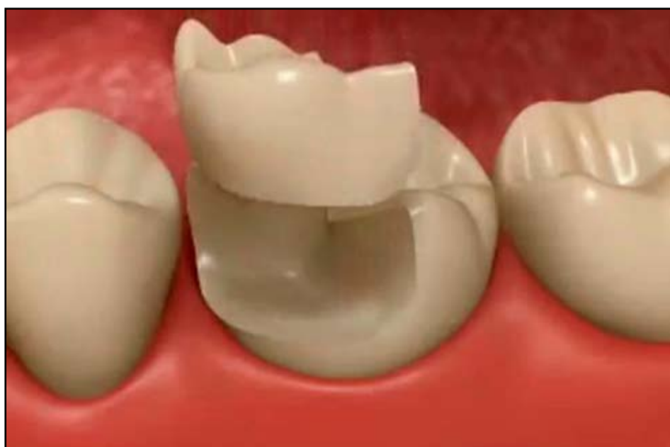
Las incrustaciones dentales se colocan en los dientes posteriores sin tocar prácticamente el diente.

Se consiguen resultados mucho mejores que con las coronas, logrando una sonrisa natural.