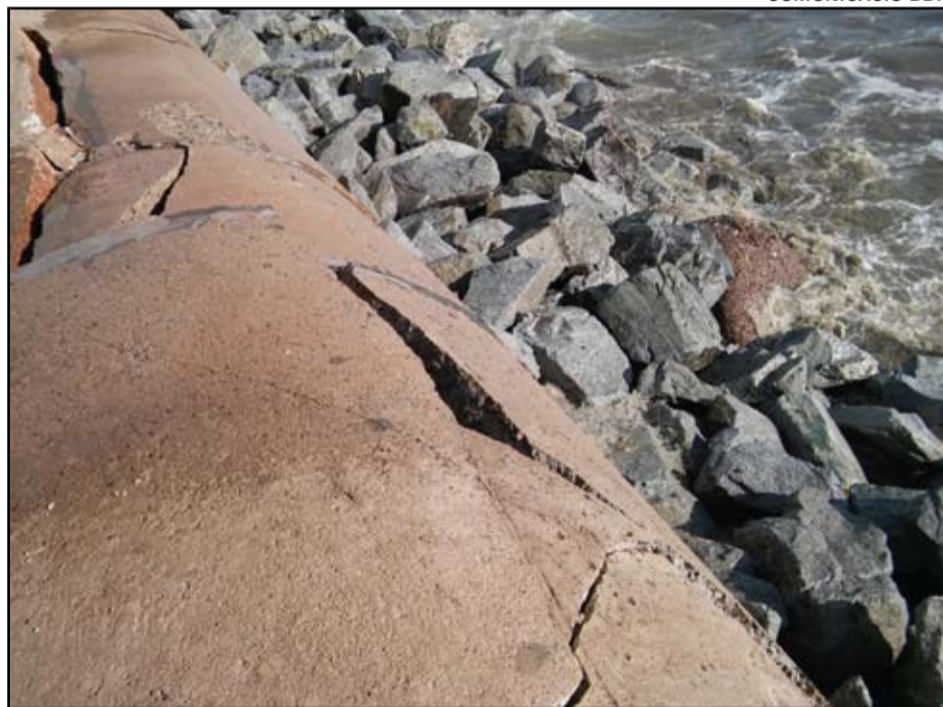
El temporal que va provocar molts maldecaps durant el passat cap de setmana va provocar danys al col·lector-interceptor de Llevant de la platja de la Mora de Badalona. Aquest col·lector és el que porta les aigües residuals de Badalona i Montgat cap a la depuradora del Besòs, al terme municipal de Sant Adrià de Besòs. L'onatge provocat pel temporal ha aixecat roques de més de 50 quilos, que en impactar contra aquesta infraestructura, hi han provocat esquerdes i l'han deixat malmesa.