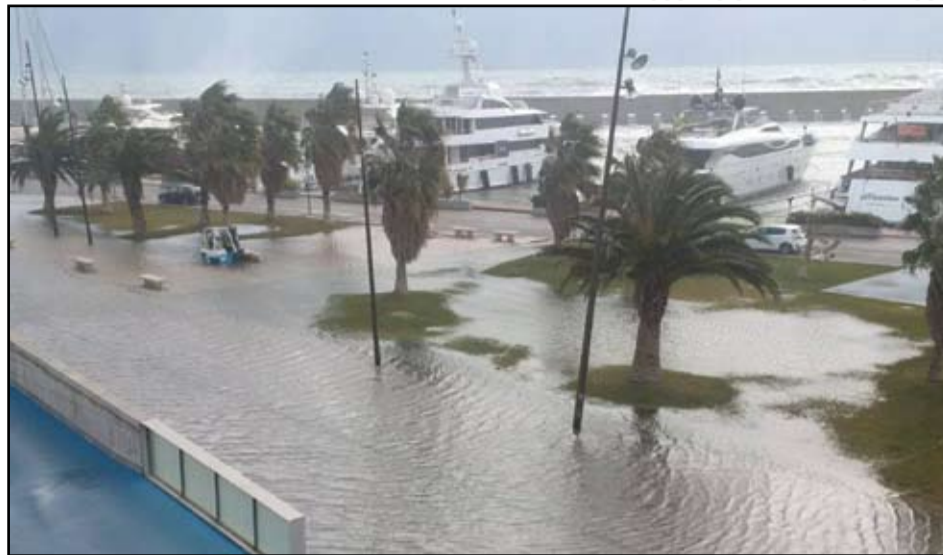
El temporal del pasado fin de semana azotó especialmente las instalaciones del Port Fòrum, inundando parte de las zonas al aire libre.