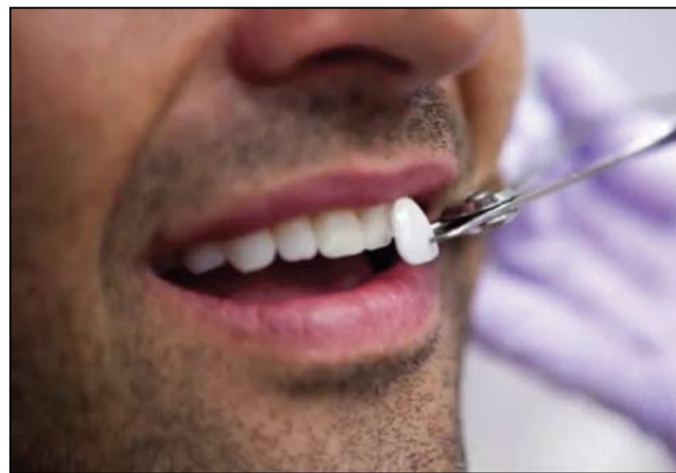
Las carillas consiguen una sonrisa natural sin destruir el diente del paciente.

En dientes posteriores en los que se usan las coronas para proteger el diente, si se endodancia un diente y matamos el nervio, normalmente se recomienda poner una corona para que la estructura superior sea toda de cerámica y el impacto de la masticación caiga sobre una superficie homogénea. "Eso mismo lo conseguimos ahora con las incrustaciones, pero también sin tocar el diente. Solo tocamos un milímetro de superficie y todo el diente se conserva. En las coronas se destruye mucho el diente y con las carillas y las incrustaciones apenas se toca. Además, conseguimos un resultado incluso mejor, mucho más natural. Cuan-