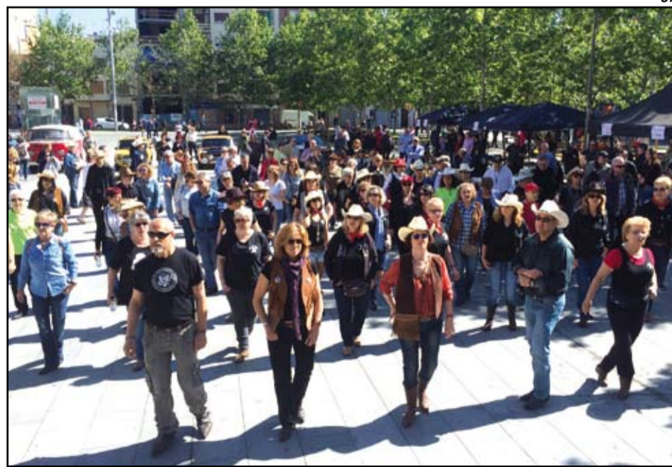
El pasado 24 de abril, la plaça de la Vila acogió una matinal "costum" solidaria con el objetivo de conseguir fondos para la investigación de la ELA. Durante toda la mañana hubo estands informativos, masajes, una exposición de motos, una exhibición de baile country y carpes con diversas actividades. El acto se enmarca dentro de la programación de actos solidarios para recaudar fondos destinados a la investigación de la ELA que culminará el 19 de junio con una ruta solidaria corriendo o caminando.