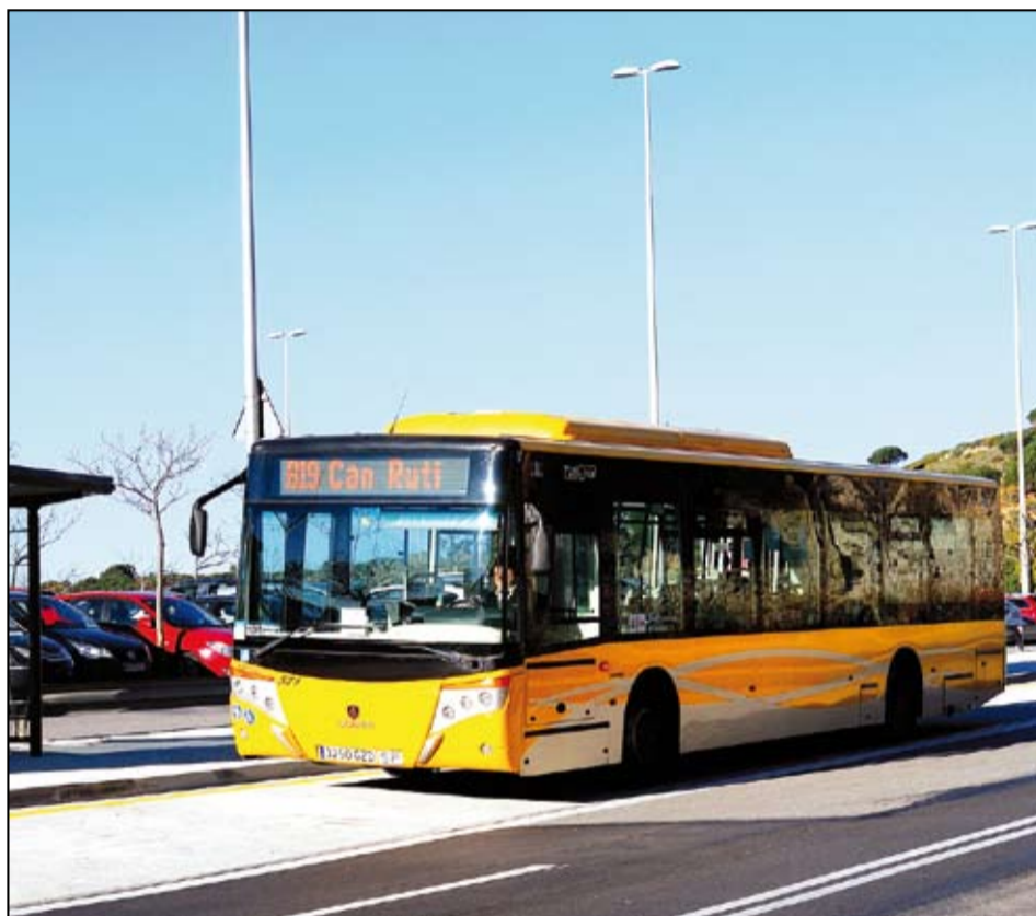
TUSGSAL incrementa el nombre de viatgers tant en el servei diürn com en el nocturn.