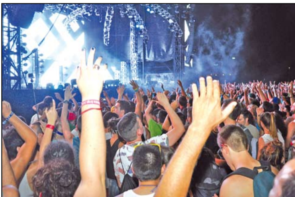
Arriba la segona edició del Barcelona Beach Festival, de nou amb David Guetta