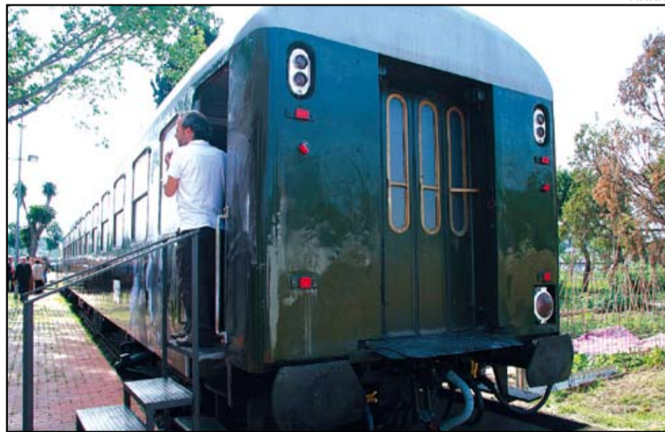
La ruta "Carrer Bolívia" comença al vagó del Sevillano, al MhiC.

La novel·la "Carrer Bolívia", editada per primer cop l'any 1999, narra la història de la Lina, filla petita d'una família humil de Linares (Jaén), una noia cànvida i carregada de bons sentiments i afany de saber que coneix el món dels senyors quan entra a Las Jaras per ajudar la mestressa. Lina es casa amb en Nèstor i la jove parella als anys seixanta, fugint de la misèria, decideixen emi-