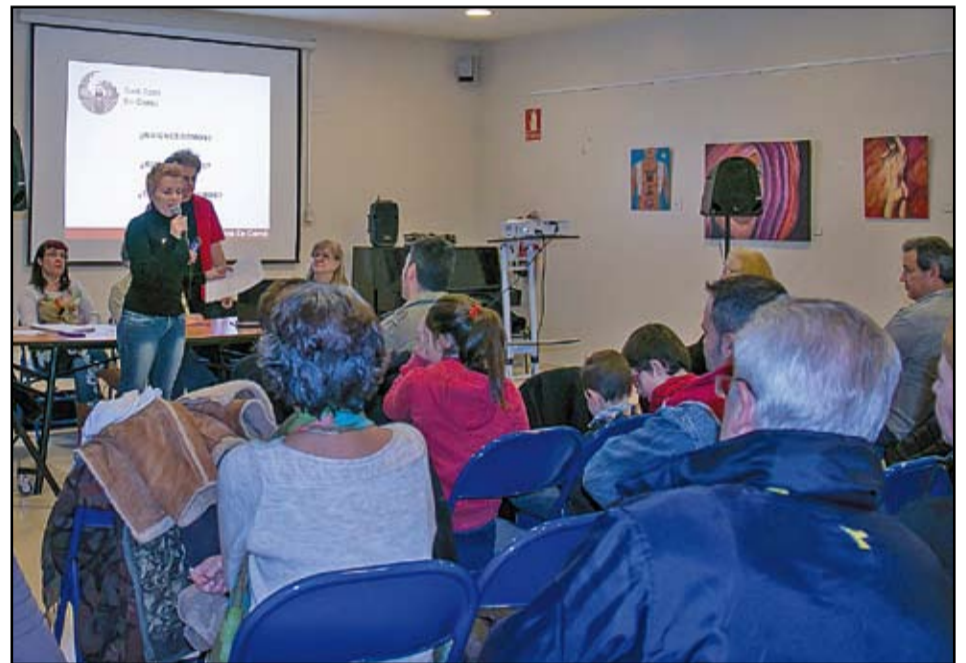
Un moment de la presentació en societat de Sant Adrià en Comú.

També s'ha presentat un resum del codi ètic al que consideren que s'hauria de comprometre tot càrrec electe i de lliure designació, i del que l'eix principal és "governar obeïnt". Com a supòsit indispensable es troba "defensar l'aplicació de la Declaració Universal dels Drets Humans en els àmbits social, polític i institucional de la nostra societat". A partir d'aquí, els tres pilars que venen a ratificar les idees