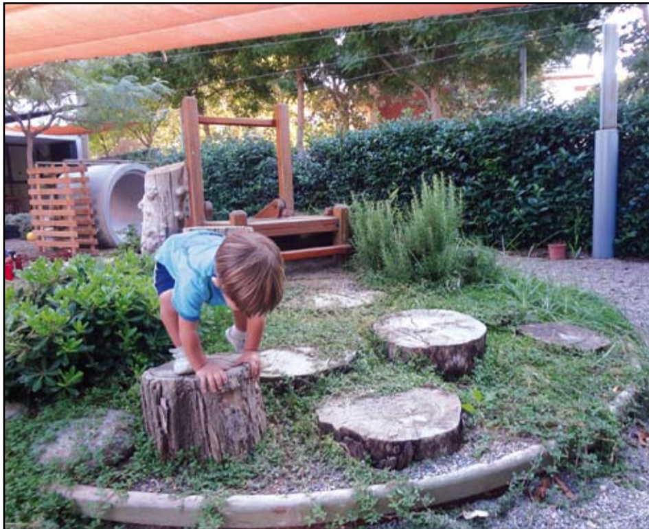
El Departament d'Ensenyament acumula un deute de 305.008 euros amb l'Ajuntament per l'Escola Bressol Josep Miquel Céspedes.

La Generalitat de Catalunya no ingressa des del curs 2010-2011 les aportacions pactades.