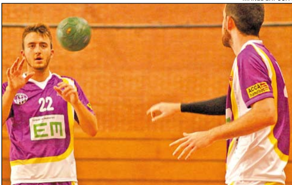
El Sant Martí Adrianenc continua amb la seva ratxa de resultats i imbatut.

Un dels partits més espectaculars es va viure a la novena jornada. Els adrianencs rebien el Sant Cugat, el segon classificat, que portava set jornades sense perdre. El primer temps va estar marcat per la igualtat,