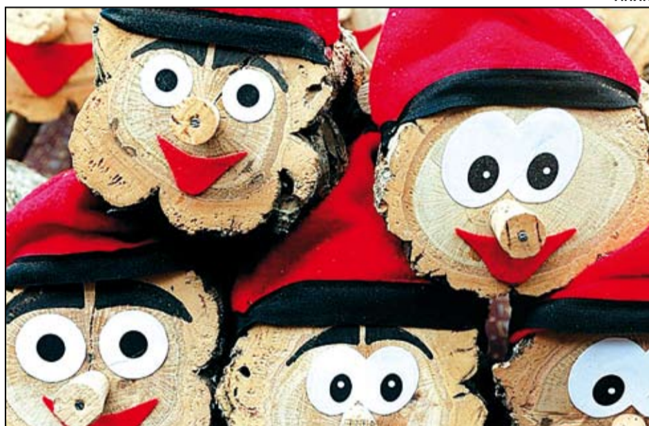
La Mina portarà el Nadal a la Rambla del 19 al 21 de desembre.

Els alumnes de les orquestres de corda i vent de l'Escola Municipal de Música Benet Baïls organitzen el proper 19 de desembre al Poliesportiu Ricart el seu tradicional