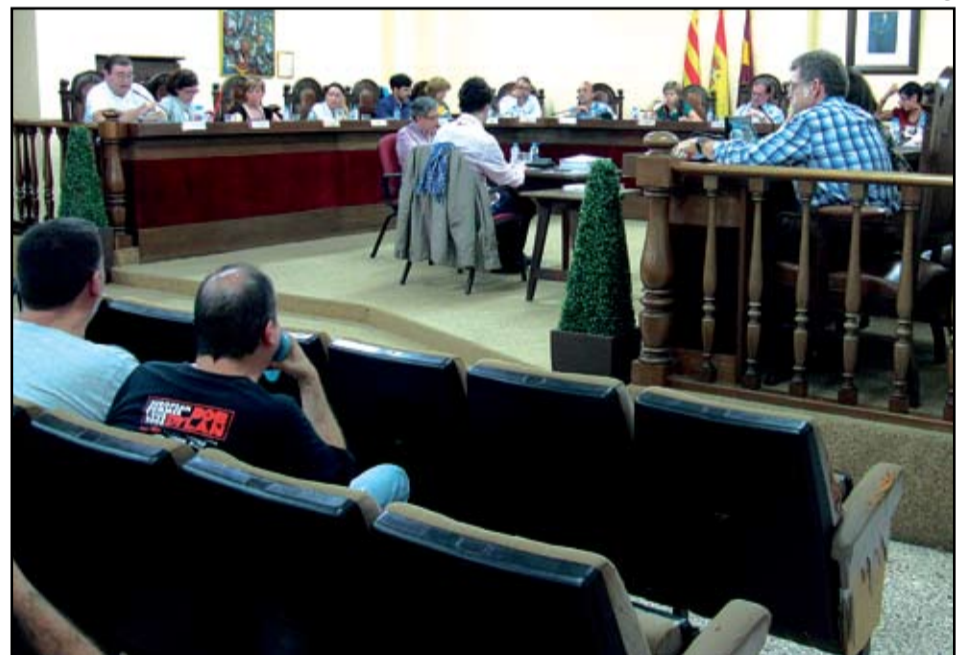
Un ple extraordinari va aprovar les taxes i impostos per l'any vinent