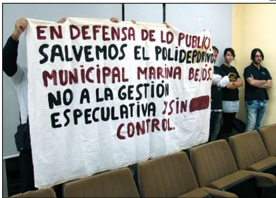
Els treballadors/es del poliesportiu Marina Besòs es van manifestar al ple de novembre.

Ho va remarcar el líder del PP, Jesús García Bragado. "Hem trigat una hora i 45 minuts per parlar del punt més important que hi havia al ple". Era un assumpte urgent, que es va tractar al final del ple i que es va acabar de discutir prop de les onze de la nit: l'aprovació d'una transferència corrent de 135.000 euros a l'empresa municipal Pla de Besòs. Un import que procedeix de la partida de 200.000 euros que al pressupost del 2014 estava destinada a subvencionar a famílies sense ingressos per cobrir les despeses de l'administració local, una nova partida que encara no s'havia fet servir. El motiu de la urgència era que Pla de Besòs, que funciona com a Oficina Local d'Habitatge, o com va afirmar Gregorio Belmonte com a "gestor i administrador de l'habitatge públic del barri de la Mina", acumula un deute de 1,3 milions d'euros que s'ha anat incrementant des del 2007. Amb l'inici de la crisi, moltes famílies no poden fer front als lloguers i altres despeses municipals, una