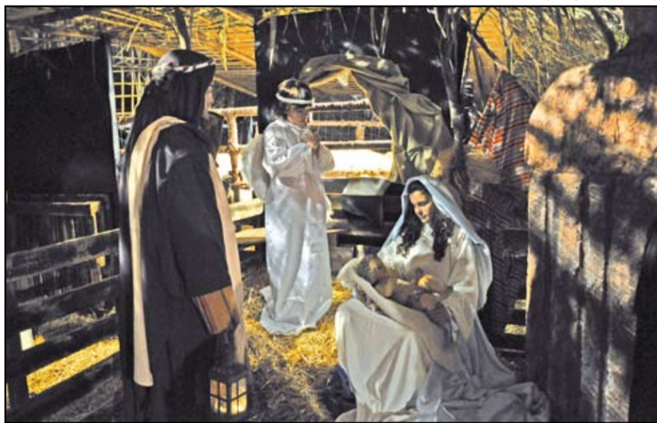
El Pessebre Vivent de Sant Adrià es pren un descans d'un any i no es muntarà als jardins del Mhic.