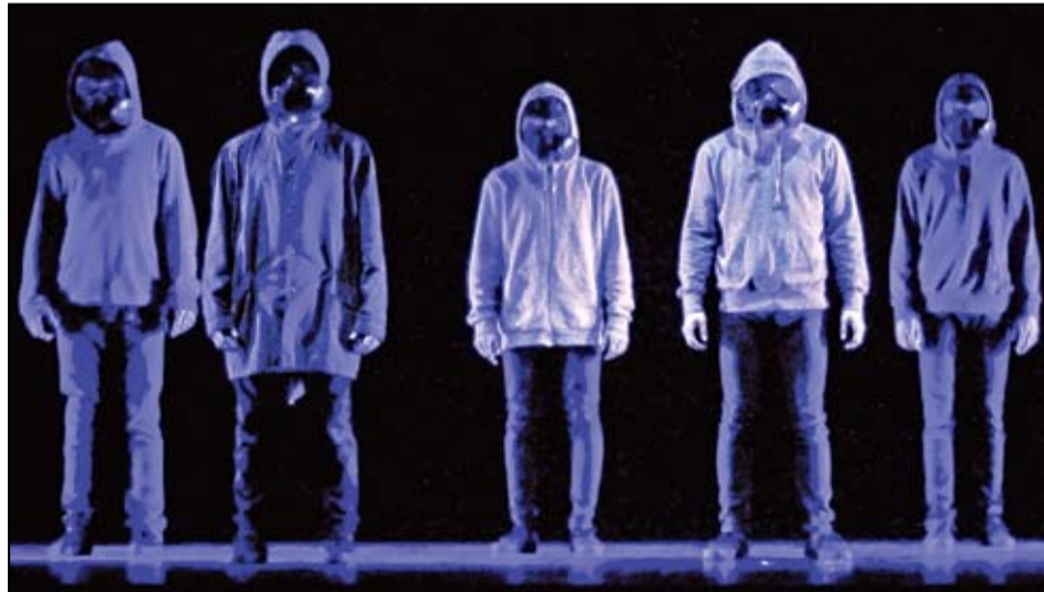
Els Iron Skulls actuaran el 28 de novembre al refugi antiaeri de la placeta Macià.

El HOP 14, que organitza l'associació cultural El Generador, comença el proper 7 de novembre amb activitats a diversos espais de Barcelona, Santa Coloma de Gramenet i Sant Adrià. Dins de la programació, destaca el segon Certamen de Creació Escènica de les Danses Urbanes, una plataforma d'exhibició i de trobada que busca impulsar i desenvolupar la creació escènica dels diferents estils de les danses urbanes. Les propostes investiguen en els nous llenguatges i formes d'interpretar les danses urbanes. El Certamen busca la renovació i la promoció de les danses urbanes. S'han seleccionat 16 propostes, 5 de companyies, 5 solos i