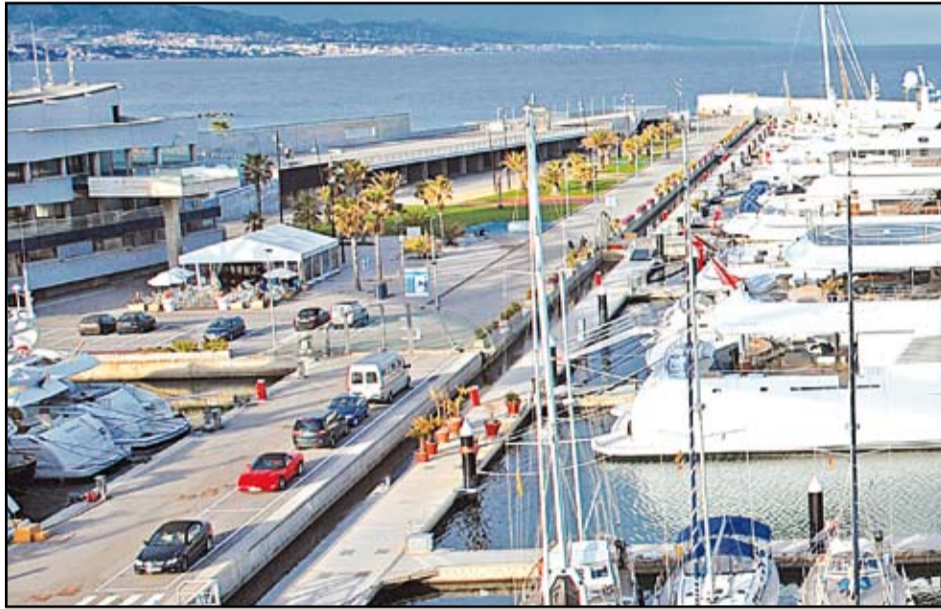
La zona on s'hauria de construir l'Amnèsia Barcelona al Port Fòrum.