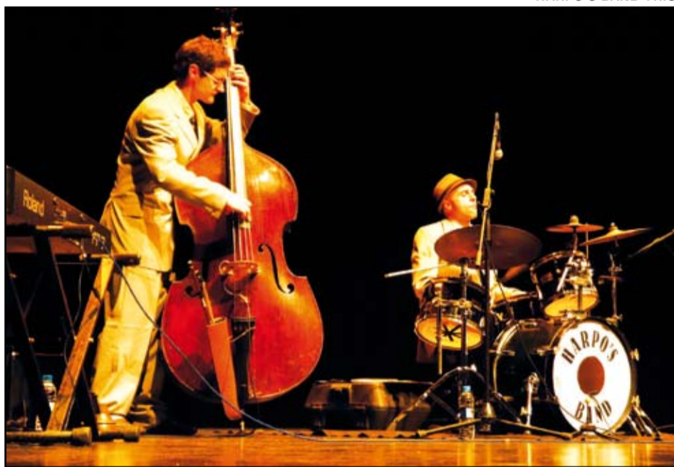
HARPO'S BAND TRIO

R. L'estil que predomina és el jazz clàssic, on els standards de swing conformen la major part del repertori. També passem pel blues,