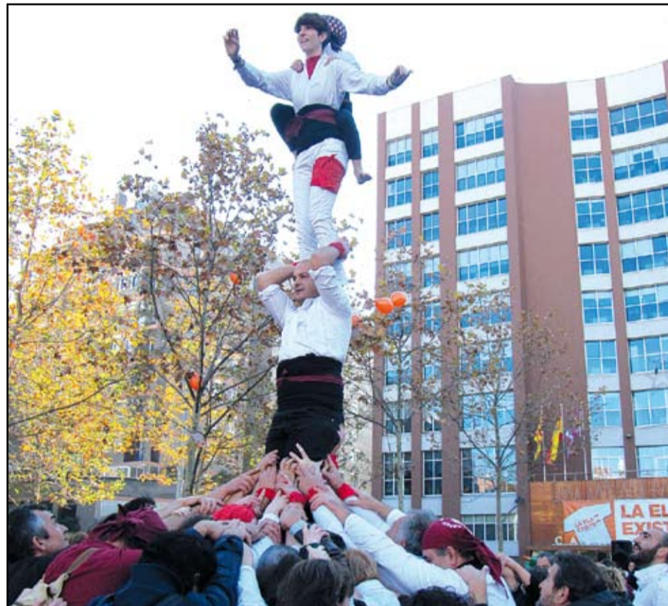
La Colla Castellera Sant Adrià celebrarà el seu bateig el 6 de setembre, amb la participació de les dues colles que li fan de madrines, la de Badalona i la de Viladecans.

Dels actes institucionals, destaquen el canvi de nom de l'Arxiu Municipal per Isabel Rojas Castroverde, i dels jardins del MhiC, que rebran el nom de Jardins Adolfo Suárez González.