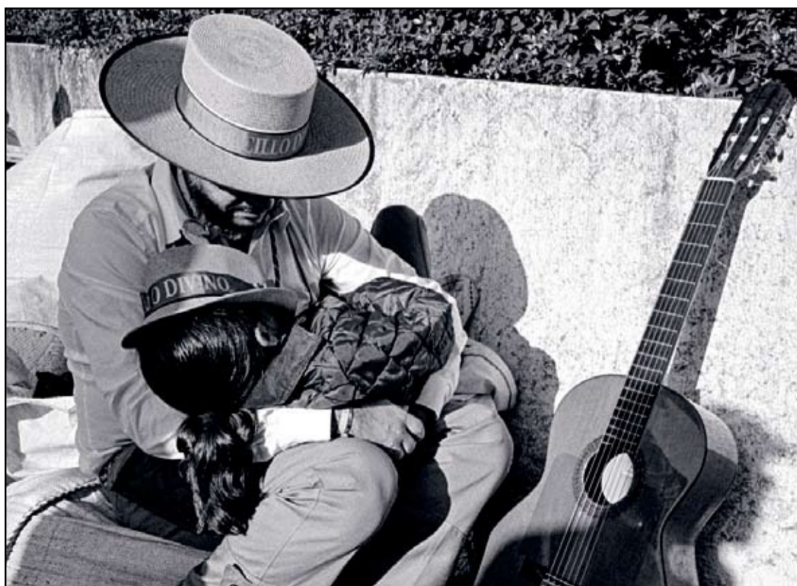
La imatge guanyadora en l'apartat Rocío 2014, "El descanso de los rocieros", de Paolo Rinelli (a dalt). A la dreta, la fotografia que va aconseguir el primer premi del concurs de fotografia de la Feria de Abril, "El guitarrista", de José Reyes.