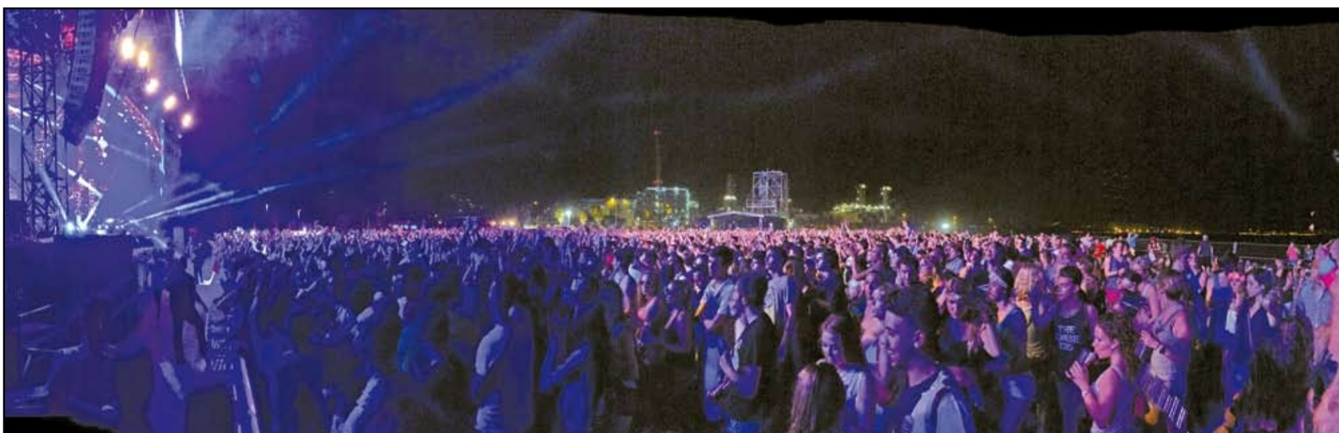
Més de 20.000 persones van assistir a la primera edició del Barcelona Beach Festival, que es va dur a terme el passat 26 de juliol a la platja de la Pau de Sant Adrià. David Guetta (a dalt, esquerra), junt amb Avicii i Steve Angello, va ser un dels reclams del festival, al voltant del qual es va produir un "macro-botellón" als aparcaments i parcs prop del recinte.