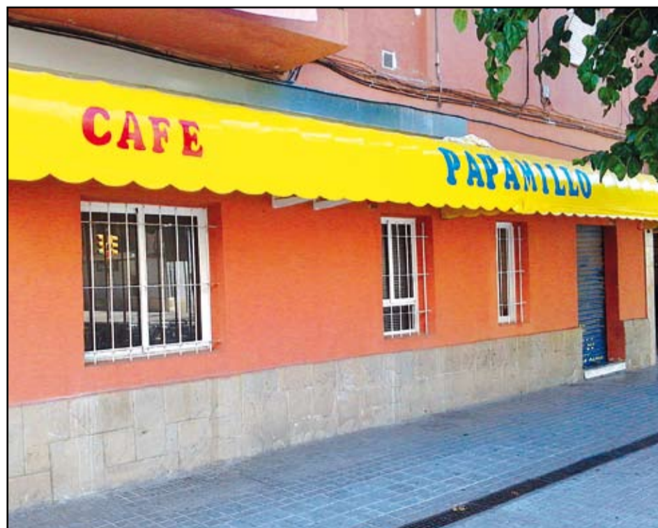
El bar es troba situat davant la plaça 25 d'octubre, del barri del Besòs.