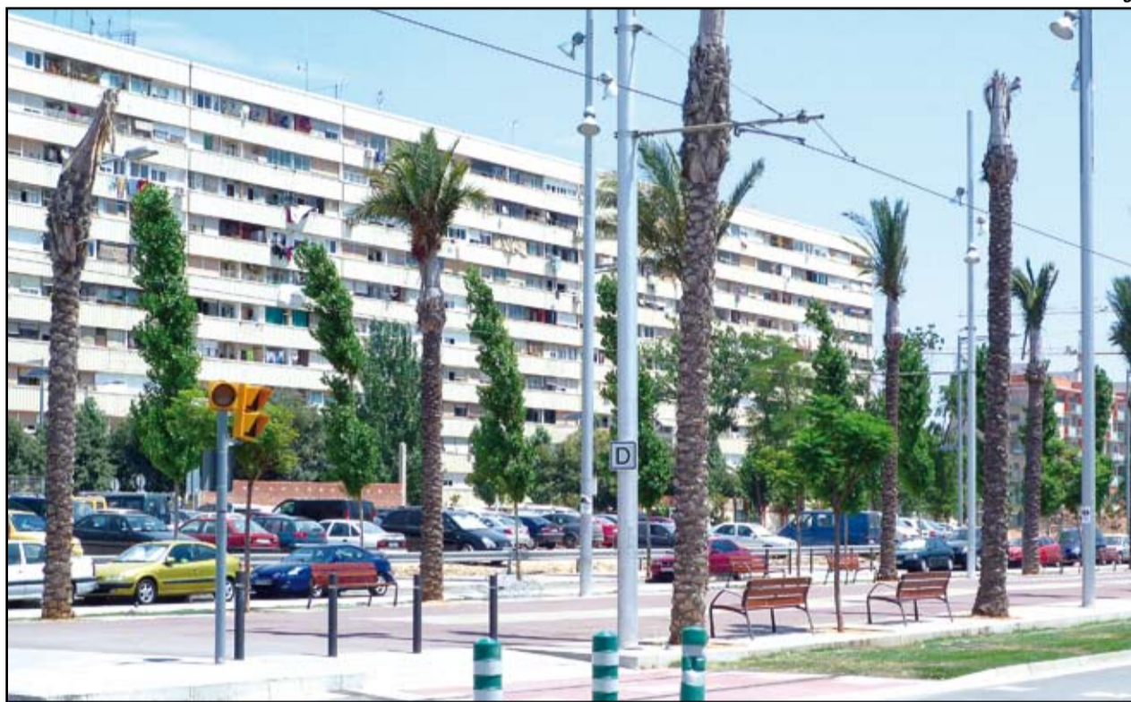
El Consorci de la Mina vol la rehabilitació de l'edifici Venus enlloc del seu enderrocament.

Des d'aleshores, 47 famílies han optat per acollir-se al procés de real·lotjament i anar a viure als nous habitatges