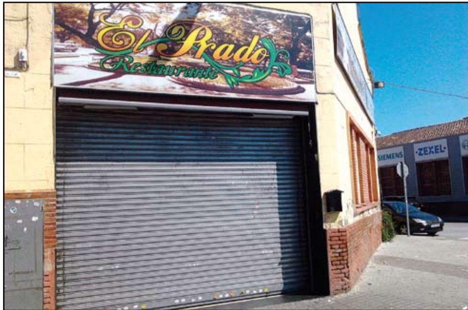
Un dels bars clausurats al polígon de Monsolís.

A més a més, l'Ajuntament també ha obert expedient de clausura al bar Puerta del Sol,