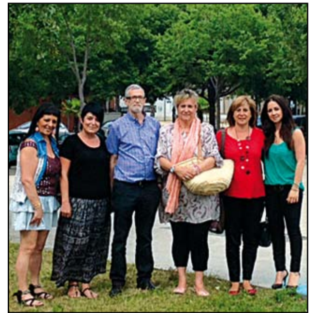
Els sis ex-membres de l'executiva local del PSC critiquen els processos de primàries engegat al partit. Marcullo (centre) no es presentarà.

Callau ha presentat 122 avals, el que suposa el 57% dels militants de l'agrupació local adrianenca. Pàg. 8.