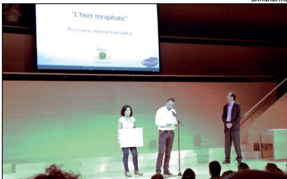
Moment de la recollida de la Beca Educar Menjant per l'Hort Terapèutic de l'AJ Barnabitas.

L'associació adriana porta dos anys duent a terme un hort urbà tradicional de verdures per al consum, que utilitzen com un mitjà educatiu durant dos cursos i de treball intergeneracional. El nou projecte se centra en la cultivació de plantes terapèutiques i aromàtiques continuant enfortint la feina de relacions entre els petits