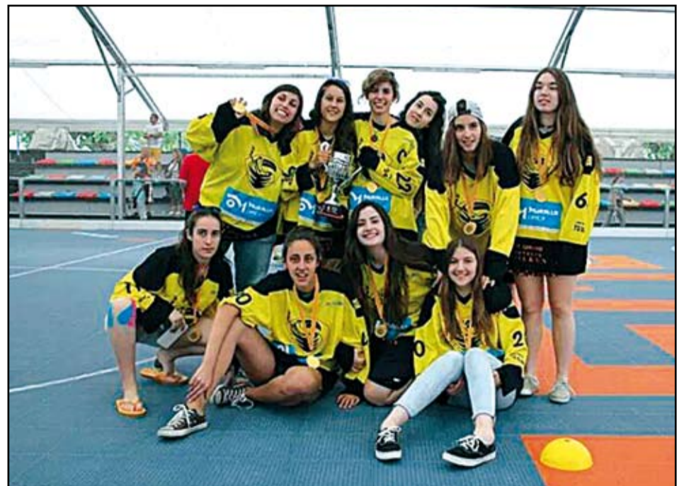
Les jugadores del Silken Tucans amb la Copa Federació.