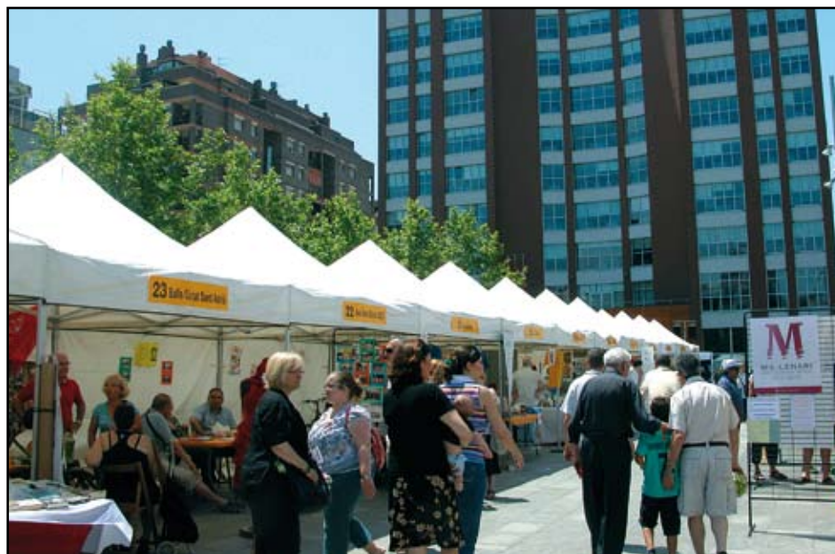
La plaça de la Vila tornarà a acollir la Mostra d'entitats el proper 7 de juny.

A més, com cada any, les entitats participants, una seixantena, mostraran als visitants la seva feina durant tot any.