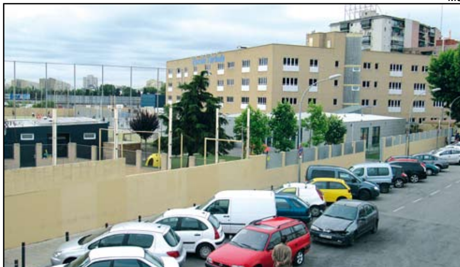
CiU ha demanat a l'alcalde que els alumnes d'escoles concertades puguin beneficiar-se de les beques.