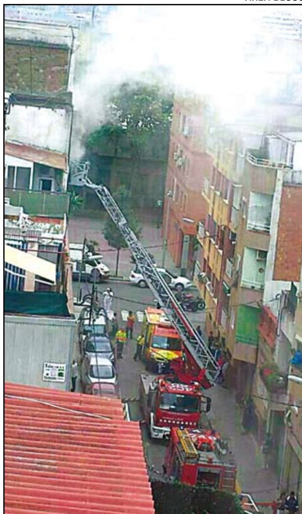
Una imatge de l'incendi mortal al carrer València.

El Sistema d'Emergències Mèdiques (SEM) també ha desplaçat fins al lloc dues unitats, que són les que han atès els ferits.