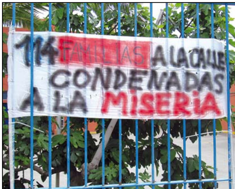
Els treballadors de Schott Ibèrica estan en peu de guerra per la decisió de l'empresa de tancar la fàbrica de Sant Adrià.

El comitè d'empresa ha manifestat en un altre comunicat que considera "injustificats" els acomiadaments i alerta que l'empresa el que vol es deslocalitzar la producció a Alemanya, tot i que "els beneficis que genera la planta adrianenca són majors dels previstos i també superiors dels que obté a Alemanya".