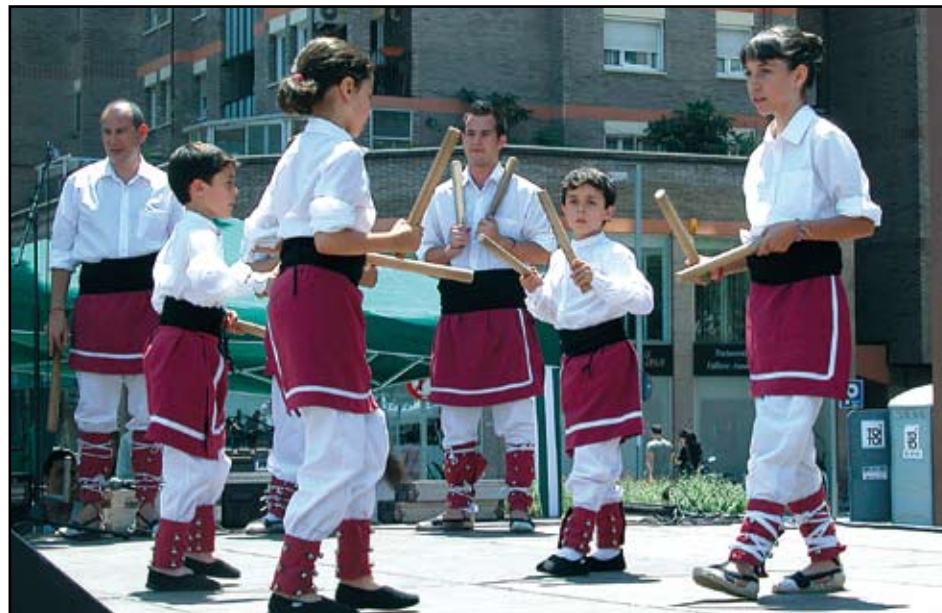
El 5 de juliol, Sant Adrià acollirà la 39a Trobada Nacional de Bastoners.

El Grup Els Laietans han creat especialment una melodia per la Trobada Nacional, una melodia que barreja la tradició amb la modernitat, un dels objectius buscats per l'Esbart. Aquesta melodia, dinàmica, fresca, alegre, moderna i tradicional alhora, s'enviarà a totes