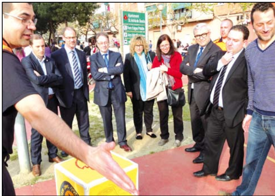
Un moment de la festa de la primavera de Barnabitas, amb algunes de les personalitats presents.

L'Associació Juvenil Barnabitas va organitzar aquest passat divendres, 11 d'abril, una festa oberta a la ciutadania en la que van donar la benvinguda a la primavera amb jocs, tallers i la presència dels gegants adrianencs. A més, van aprofitar l'acte per presentar el projecte "un berenar sa i per a tothom", en el que diàriament participen nens i nens amb especials dificultats socioeconòmiques. A partir del tercer trimestre tindran l'oportunitat de gaudir d'un berenar sa i equilibrat i compensar les deficiències alimentàries i educatives del fet de no portar berenar. En total