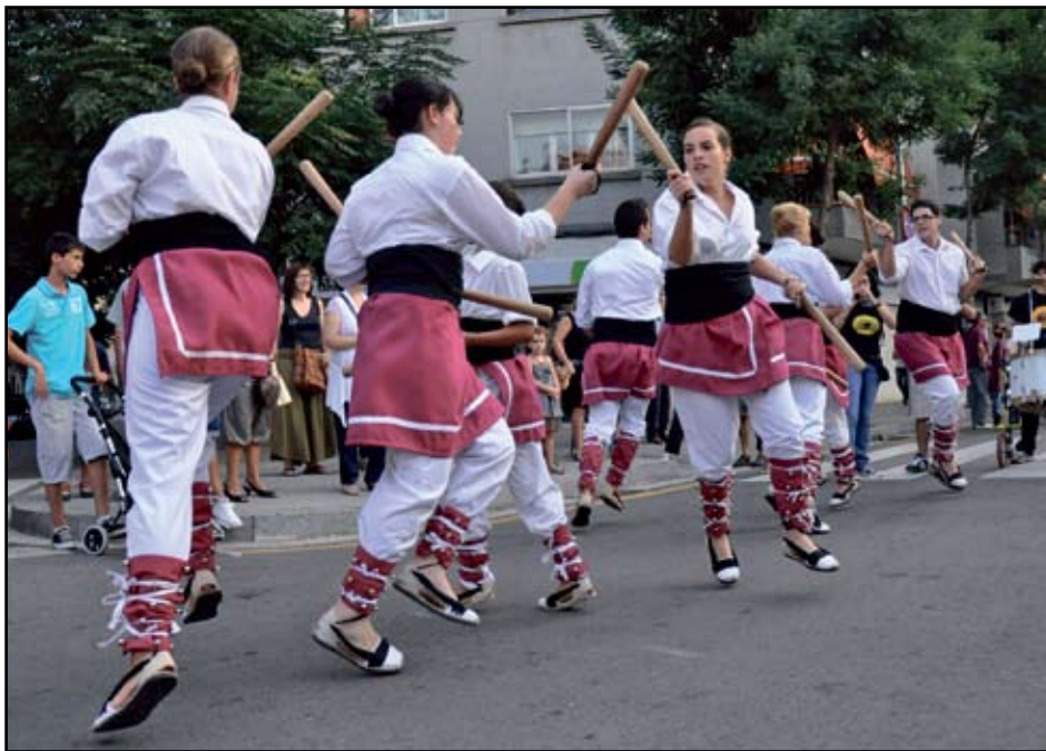
El 5 de juliol, Sant Adrià acollirà la 39a Trobada Nacional de Bastoners.

Podeu trobar més informació a la web de l'Esbart Dansaire Sant Adrià.