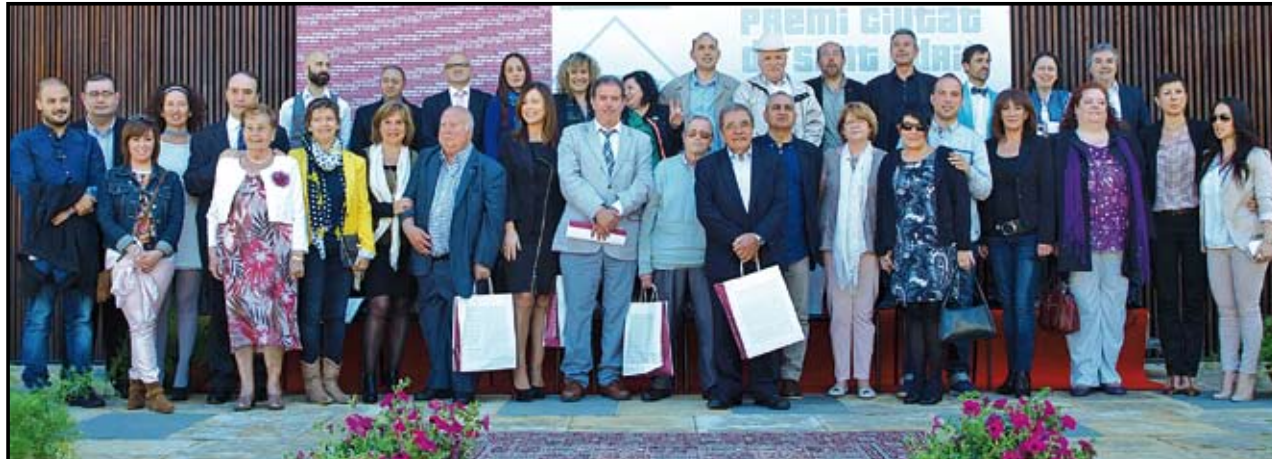
Fotografia amb tots els guardonats amb el Premi Ciutat de Sant Adrià.