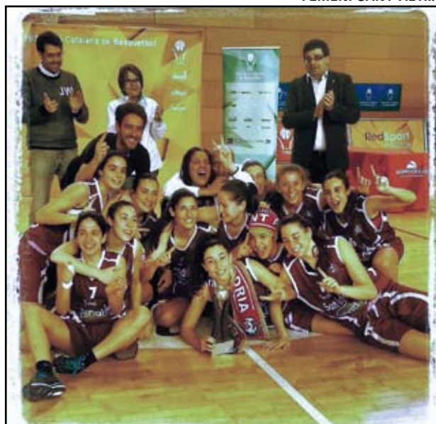
FEMENÍ SANT ADRIÀ

La gran final es viuria com un partit de gran nivell entre les jugadores dels dos equips que la disputarien. L'Almeda va plantar cara durant els 40 minuts de partit i a estones semblava que