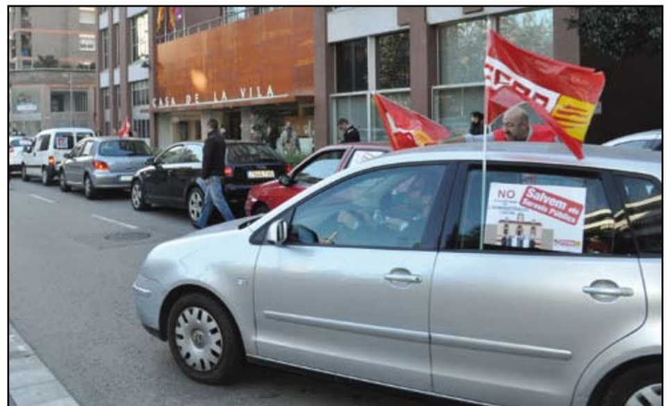
La Caravana contra la Reforma de l'Administració local va arribar a Sant Adrià

A la protesta han participat més de 150 cotxes per tota Catalunya, que al migdia s'han concentrat davant la subdelegació de Govern per lliurar les signatures recollides al llarg del territori en contra de l'anomenada Llei de Reforma i Sostenibilitat de l'Administració Local.