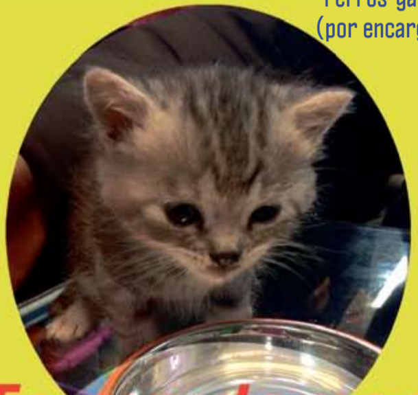
Perros-gatos (por encargo)