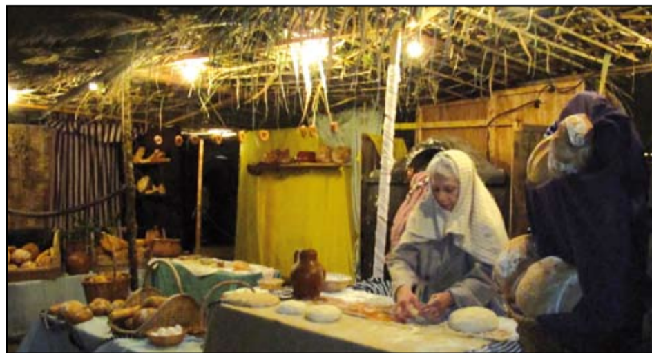
El Pessebre Vivent de La Catalana es podrà visitar al MhiC el 21, 22, 25, 26 i 29 de desembre.

L'Associació de Comerciants de la Mina organitza la cinquena Fira de Nadal a la Ronda Sant Ramon de Penyafort, entre els carrers de Ferrer Bassa i Cristòfol de Moura del 20 al 22 de desembre. Durant els tres dies hi haurà una mostra de productes nadalencs i activi-