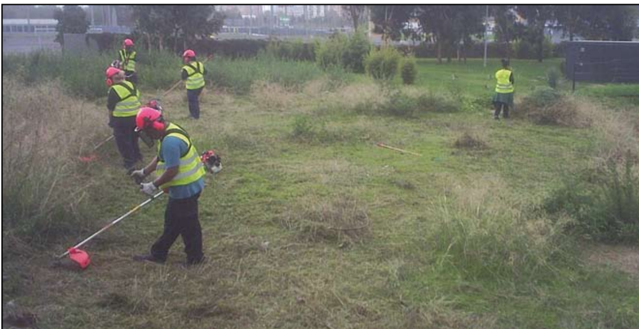
Imatge de l'anterior pla integral de neteja que va permetre la contractació de treballadors de la ciutat.

Les persones preseleccionades en convocaran mitjançant l'Oficina de Treball de Sant Adrià de Besòs.