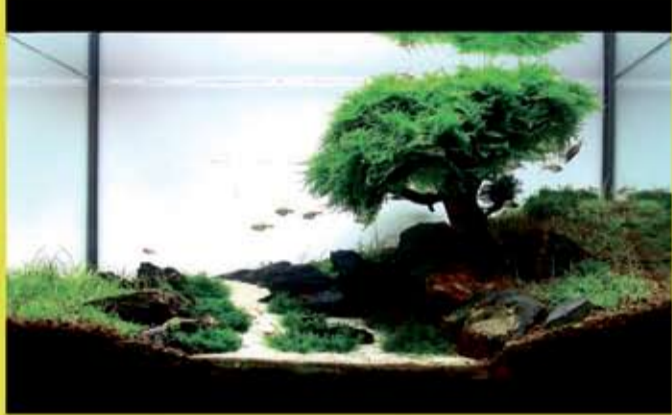
Todo en acuarios