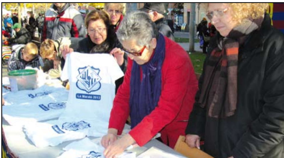
L'Esbart Dansaire i la Penya Espanyolista van ser algunes de les entitats participants. A la dreta, la Colla Castellerà Sant Adrià va realitzar el seu primer pilar de quatre. MS

La campanya "La ELA existe" va ser tot un èxit a la ciutat i per ara s'han recaptat prop de 7.500 euros.