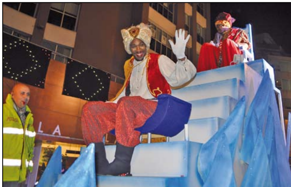
Ses Majestats d'Orient tornaran a Sant Adrià el proper 5 de desembre.

Al gener l'any comença amb la 19a edició del Saló Infantil i Juvenil Adrilàndia, que enguany es farà els dies 3 i 4 de gener, als espais de la Rambleta, Poliesportiu Ricart, pati de l'escola Sant Gabriel i Centre de producció cultural i juvenil Polidor amb jocs, tallers, espectacles i moltes sorpreses. L'horari del Saló serà de 10.30 a 14 h i de 16.30 a