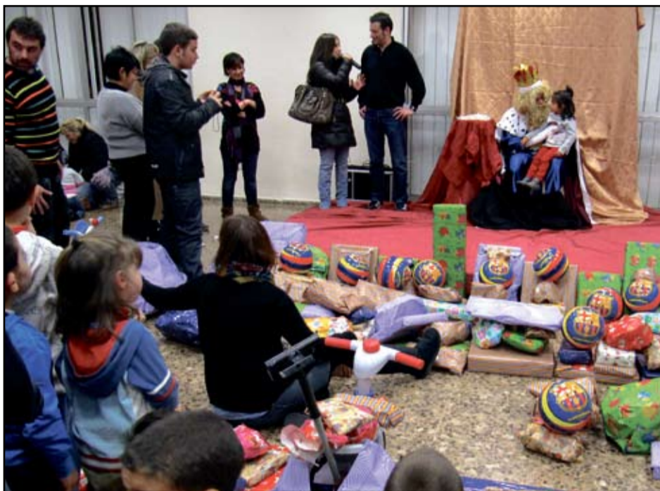
El Rei Melcior tornarà a lliurar joguines als infants més necessitats de la ciutat.

En les darreres edicions s'han repartit joguines entre més de mig centenar d'infants. Enguany es vol arribar a un cente-