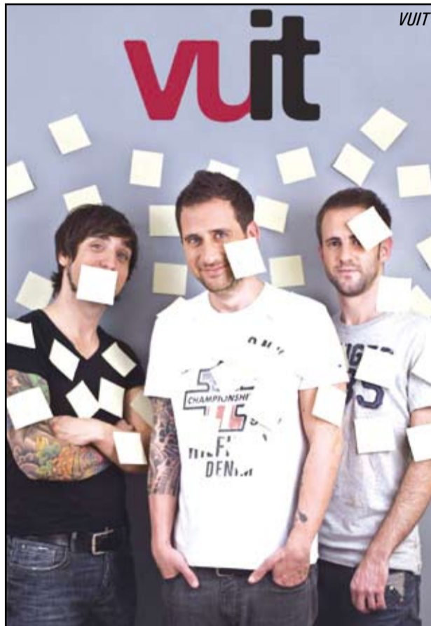
Vuit actuaran el 7 de setembre, a les 22.30 h. a la plaça de la Vila.

R. Disc rere disc evolucionem, sempre hi ha noves inquietuds i nous missatges que volem fer arribar. El nostre darrer disc és molt directe i, probablement l'exercici d'improvització (meditada) més gran que hem fet fins a la data.