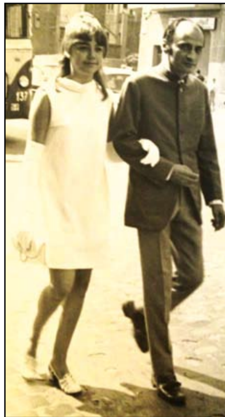
La reina dels Jocs i el mantenidor encapçalen la comitiva (1968).

Tot això fou la causa que, en tornar a St. Adrià, em posés a escriure frenèticament per explicar tot allò, tant nou, que jo havia vist... i publicar-ho en la