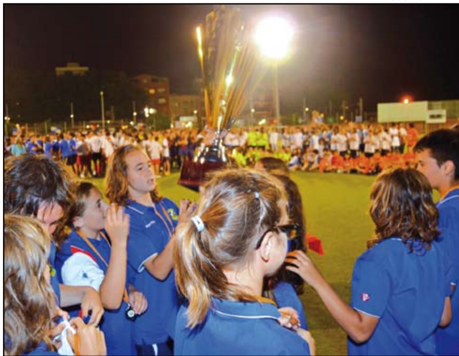
Les gabrielistes van guanyar el títol a la categoria de G12 després de guanyar a l'Espanyol per 3 a 0.

A les 18:30 h. es va jugar la final masculina B12 en el qual es va proclamar campió el Cornellà golejant 4 a 0 a la Damm. A les 19:45 h. es va jugar la final femenina G12 en el qual es va proclamar campió el CE Sant Gabriel golejant 3 a 0 al RCD Espanyol, amb el protagonisme d'Ainhoa