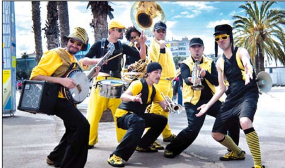
Els Always Drinking Marching Band actuaran a la Festa Major el diumenge, 8 de setembre.

Com a acte institucional, i molt simbòlic en aquest cas, destaca la inauguració de la sala Neus Bouza a la Bibliote-