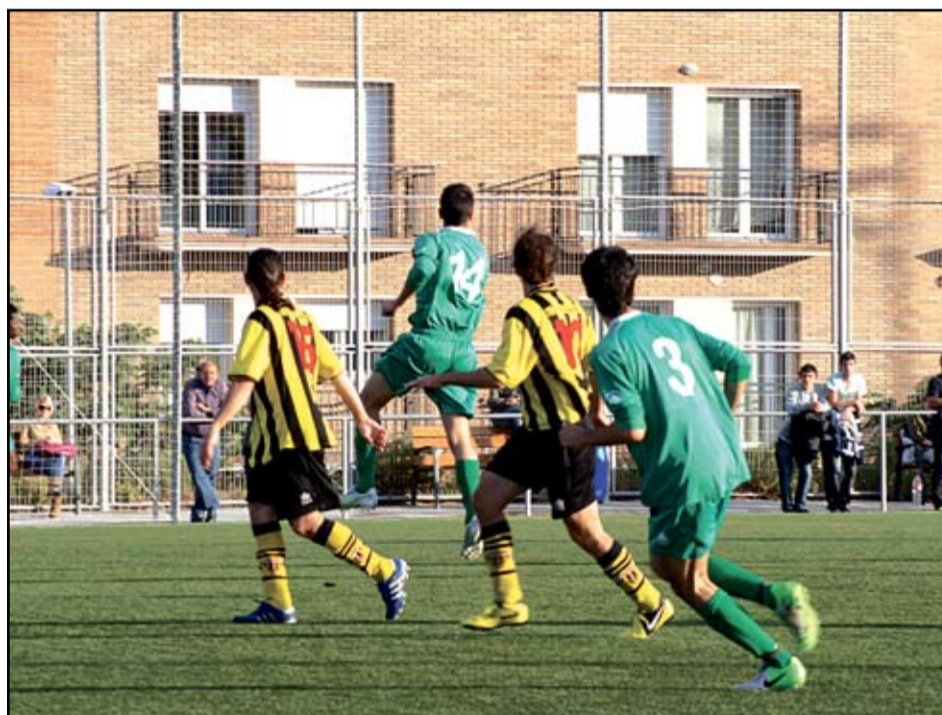
La Catalana va caure a les primeres de canvi de la Copa Catalunya per un contundent 4 a 1 al camp de La Llàntia i diu adéu a la competició autonòmica.

L'equip adrianenc començava dominant el partit, es sentia còmode al camp. Tot i tenir la possessió de la pilota durant pràcticament el primer temps, La Catalana només gaudiria de dues clares ocasions de gol. La primera arribà al minut 5. Un xut de Danielo sortiria fregant