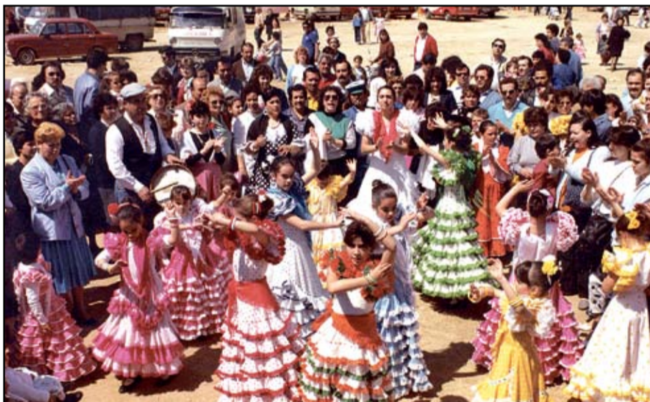
Dues de les fotografies que formen part de l'exposició "Catalunya de Feria"

de Sant Adrià romandrà tancada per vacances de Nadal del 22 de desembre a l'1 de gener de 2013.