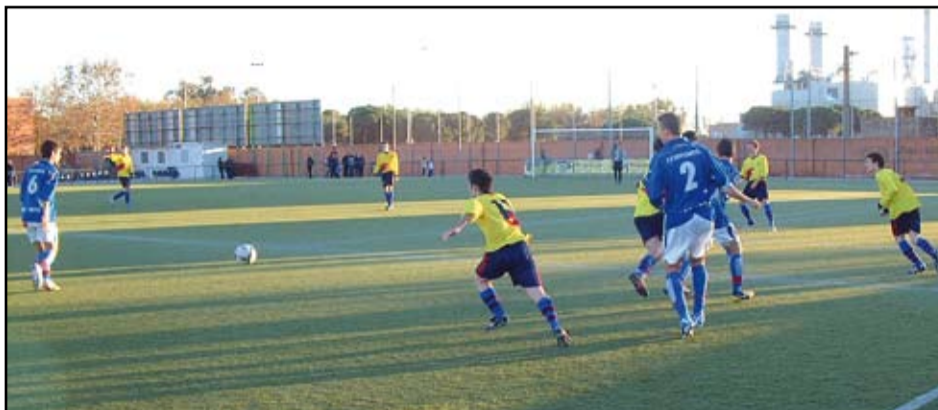
Una imatge del partit entre el Sant Gabriel i la Penya Barcelonista Anguera.

La P a Barc. Anguera va visitar el Ruiz Casado a la següent jornada de lliga amb el Sangra situat a la quarta posició. El seu rival no passava pel seu millor moment ja que ocupava la primera zona del descens. La jornada es va presentar factible pel