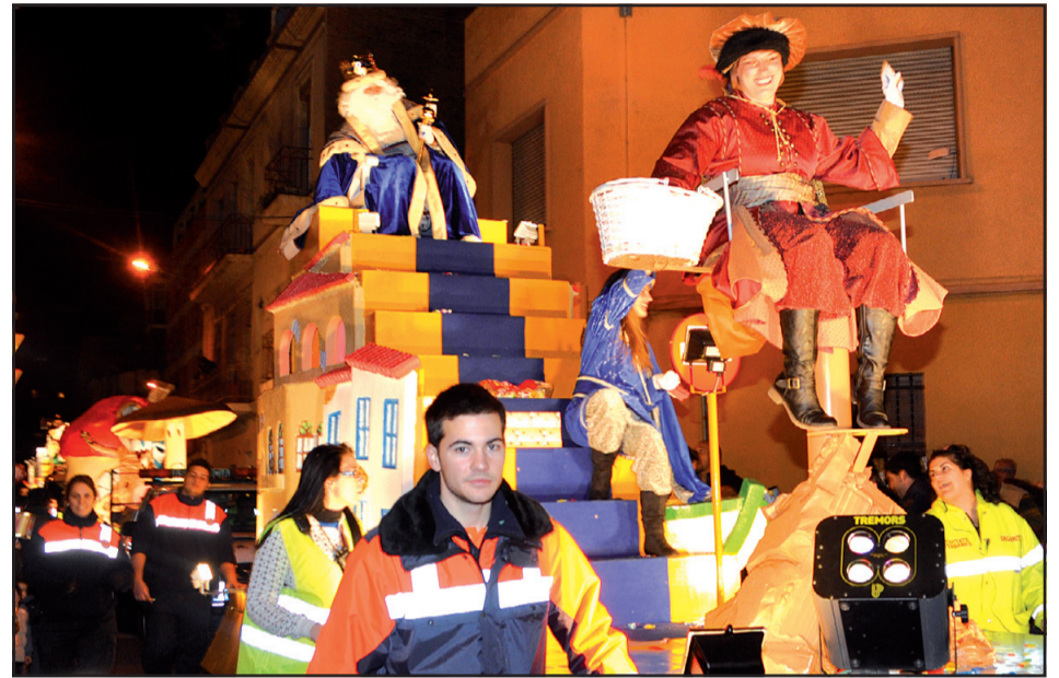
Ses Majestats els Reis d'Orient arriben a Sant Adrià el 5 de gener.

Els Pastorets es representaran a l'entitat cultural més antiga de Sant Adrià el 23 i 30 de desembre amb entrades a 5 i 6 euros. Pàg. 5.