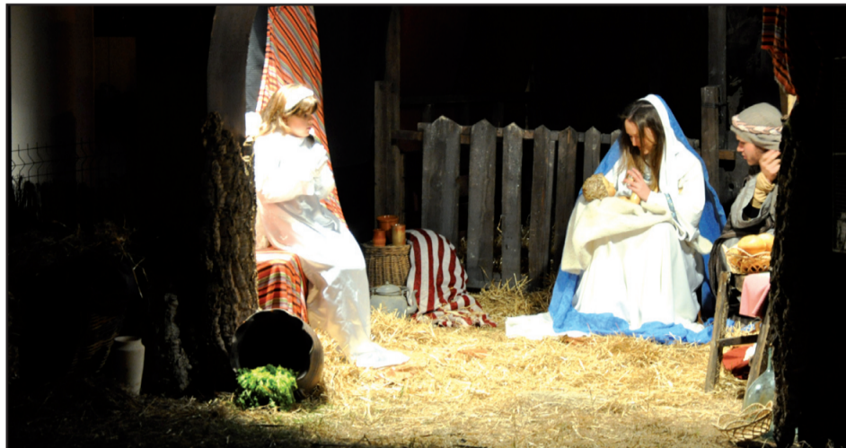
El Pessebre Vivent torna als jardins del MhIC.

Al gener l'any comença amb la 18a edició del Saló Infantil i Juvenil Adrilàndia, que enguany es farà els dies 3 i 4 de gener, omplint els espais de la Rambleta, Poliesportiu Ricart i Centre de producció cultural i juvenil Polidor amb jocs, tallers, espectacles i moltes sorpreses. L'horari del Saló serà de 10.30 a 14 h i de 16.30 a 20 h els dies 3 i 4 de gener.