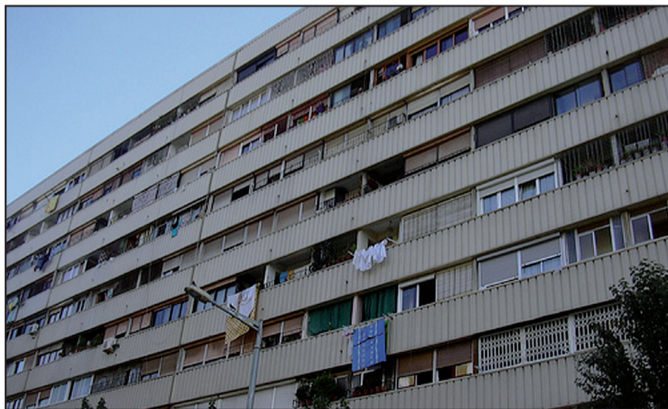
Creuament de declaracions entre ICV-EUiA i CiU per l'enderroc de l'edifici del carrer Venus. ICV-EUiA