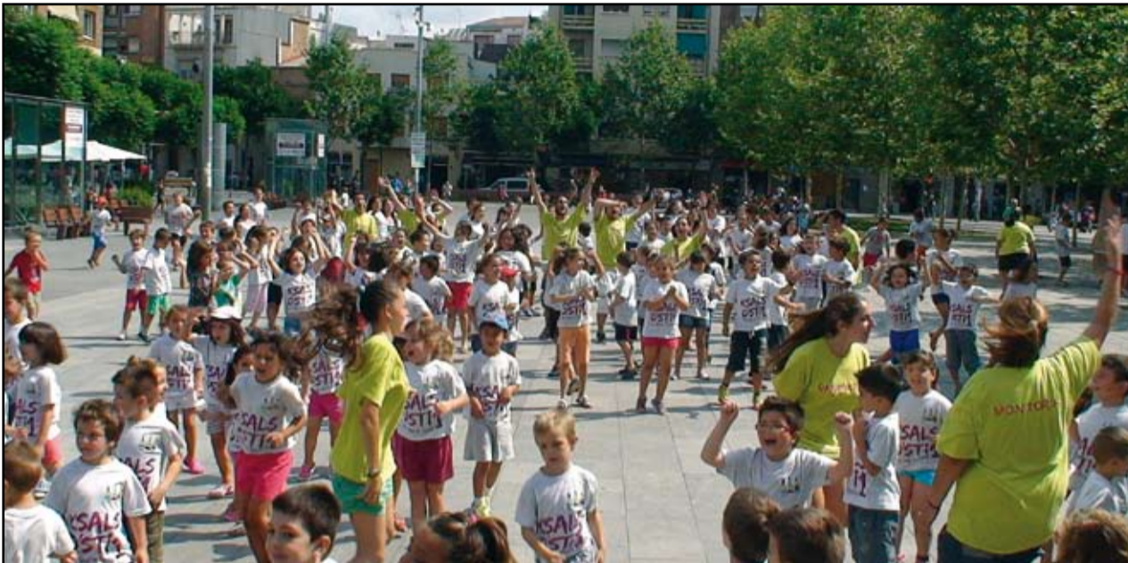
Una de les moltes activitats del Gadgetosplai, a la plaça de Vila.