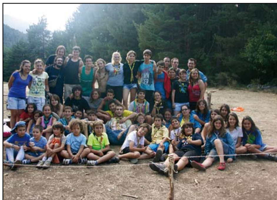
Fotografia de família del CAU Sant Adrià al darrer Campus d'estiu.