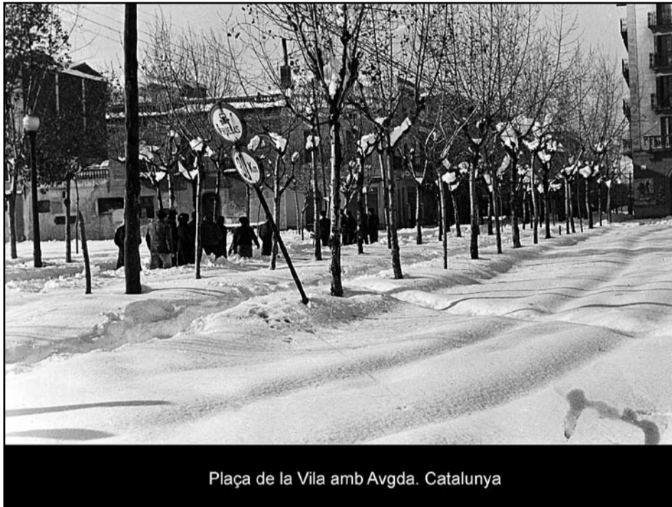
Plaça de la Vila amb Avgda. Catalunya

Com és habitual, l'Agrupació Fotogràfica inicia una nova temporada amb exposició més esperada per tots els adriencs "Sant Adrià antic".