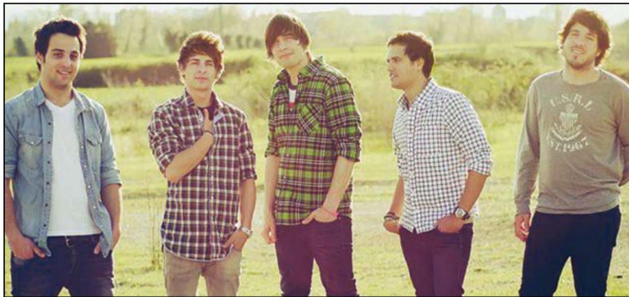
Els "Amelie" estan gravant ja el seu segon disc. Potser podrem escoltar nous temes al seu concert de Festa Major.

R. Vam tenir la sort d'ajuntar-nos 5 millors amics amb moltes ganes de fer coses i treballar pel nostre somni, vam