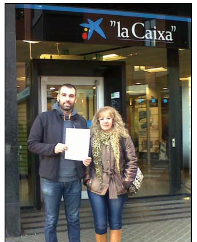
Com a mostra de protesta contra les participacions preferents, membres d'ICV Sant Adrià van treure tots els diners dels seus comptes de les entitats bancàries implicades. ICV