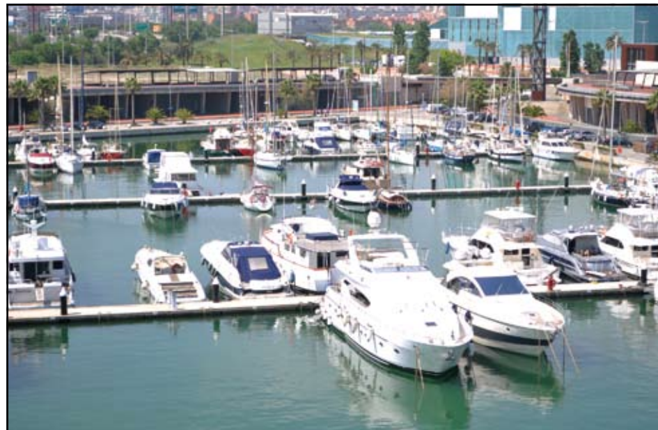
La discoteca Amnesia Barcelona es podria instal·lar al Port Fòrum de Sant Adrià.