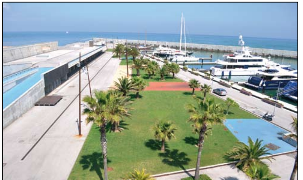
El Port Fòrum podria dinamitzar-se amb la construcció de la discoteca Amnesia Barcelona. JP

La principal avantatge del projecte són els llocs de treball que es crearien. "L'alcalde té un compromís amb l'empresari per què els llocs de treball