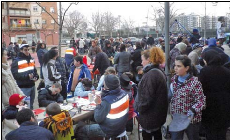
Més de 70 nens van participar a la festa de Carnestoltes de l'Associació Juvenil Barnabitas, que van gaudir amb la desfilada de disfresses, els tallers i la xocolatada.