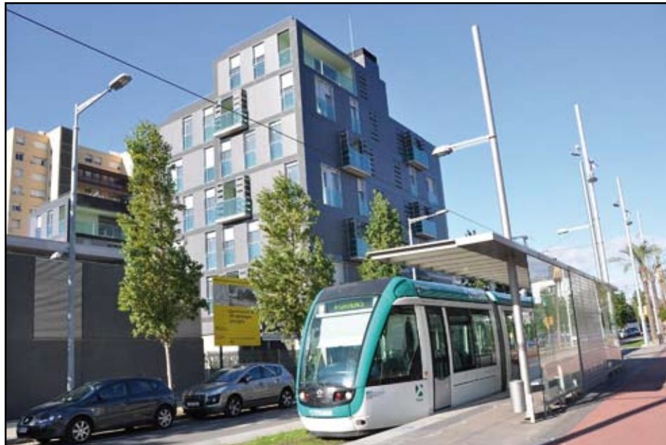
La línia T6 del Trambesos funciona de Glòries a l'Estació de Sant Adrià.

Aquestes línies han conviscut amb importants problemes de seguretat i vandalisme. De fet, fa poques setmanes l'empresa va començar a treballar amb mediadors de barris per evitar aquests fets. Així, compten amb la col·laboració de veïns de La Mina i de Sant Roc, a Badalona.