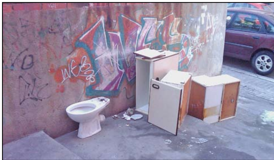
Actes de vandalisme i incivisme als carrers badalonins, cars per la ciutat.

Les intervencions en contenidors cremats