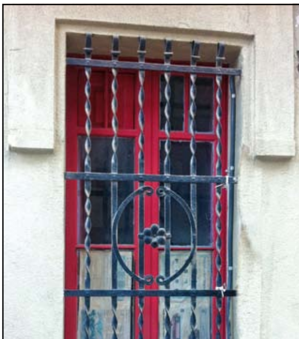
Ja és hora de canviar les teves finestres de fusta.

El Pla Renova't de Finestres té com a objectiu fomentar la substitució de tancaments vells (finestres, portes-vidrieres, claraboies, ...) per altres de noves, amb més aïllament tèrmic, tant en habitatges particulars com en edificis del sector terciari, de manera que es produeixin estalvis mínims del 20% en el consum d'energia pel que fa a la climatització. Amb aquest mateix objectiu, també se subvencionarà la renovació o incorpora-