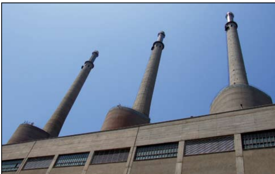
La plataforma per la conservació de les tres xemeneies ha presentat a l'Ajuntament una sol·licitud perquè les declarin Bé Cultural d'Interés Local PCX

immediates, la protecció del conjunt industrial, la recuperació de les visites escolars, l'organització de visites de turisme industrial obertes a tothom, i el seu progressiu condicionament de cara a la seva utilització com a equipament cultural. Simultàniament, proposa desenvolupar el Pla d'Acció Cultural aprovat el 2009 per l'Ajuntament i engegar un estudi seriós que defineixi un "Pla d'usos i viabilitat" que orienti les inversions futures i la reutilització definitiva del conjunt històric comptant amb la participació d'institucions supramunicipals.