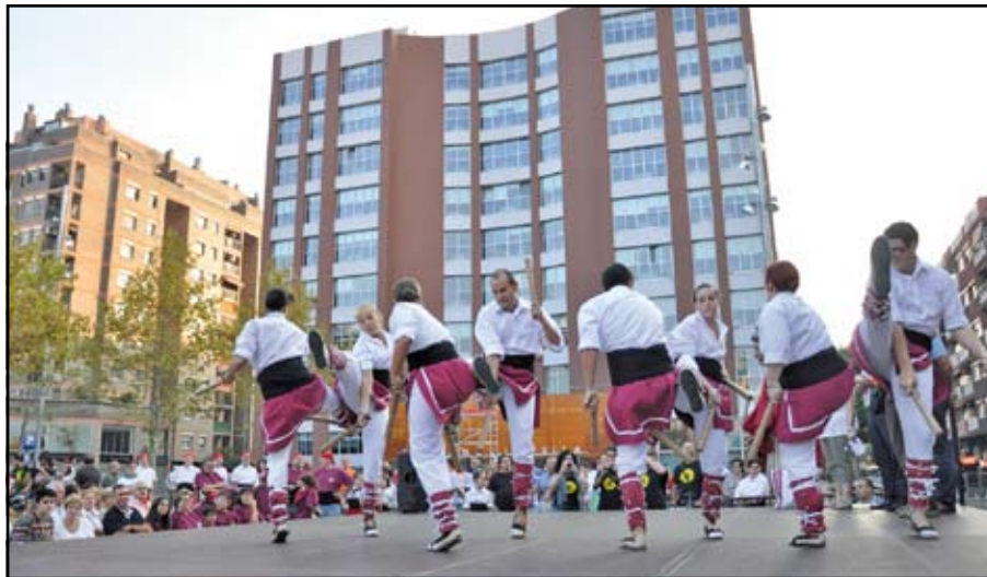
Els bastoners de l'Esbart Dansaire, durant la seva actuació a la plaça de la Vila, on també van actuar els nous gegantots, la Cuqueta i el Nassut.

En comptes del barri del Besòs, aquesta vegada l'esdeveniment va tenir lloc a la plaça de la Vila. O com a mínim, aquí va començar, ja que es va realitzar una cercavila de bastoners, grallers i gegants per diversos carrers del centre. A més dels grups locals com l'Esbart Dansaire, els Bastoners, la Colla Gegantera i