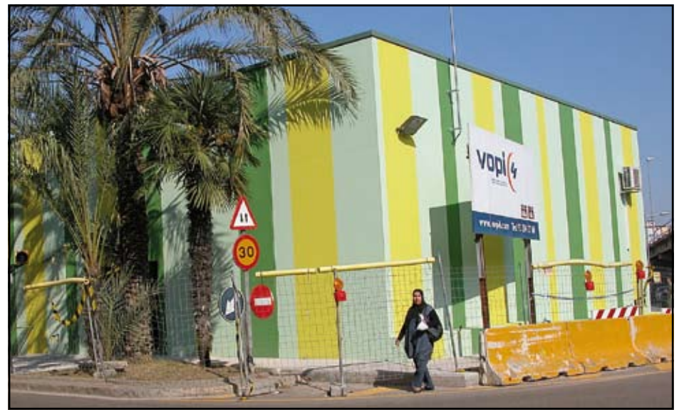
A partir del proper mes, els paradistes del Mercat Municipal es traslladaran a la carpa provisional, situada a la plaça Rosa Sensat, on romandran fins que el nou edifici estigui llest. MS

Finalment, el cost del nou Mercat Municipal, que hauria d'haver estat enllestit fa prop de quatre anys, serà de 9,2 milions d'euros. L'Ajuntament de Sant Adrià de Besòs es farà càrrec de 1,7 milions, mentre que els paradistes aportaran 2,5 milions, i Mercadona la resta, 5 milions d'euros. Pàg. 4.