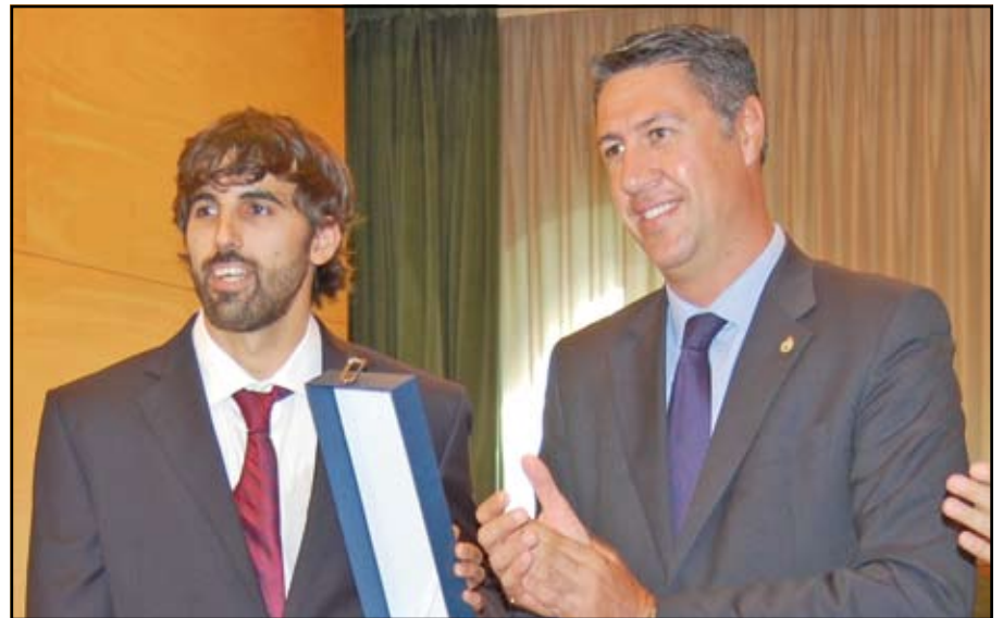
L'Ajuntament de Badalona va oferir el passat 13 d'octubre una recepció al jugador badaloní de bàsquet, Víctor Sada, campió de l'Eurobàsquet.