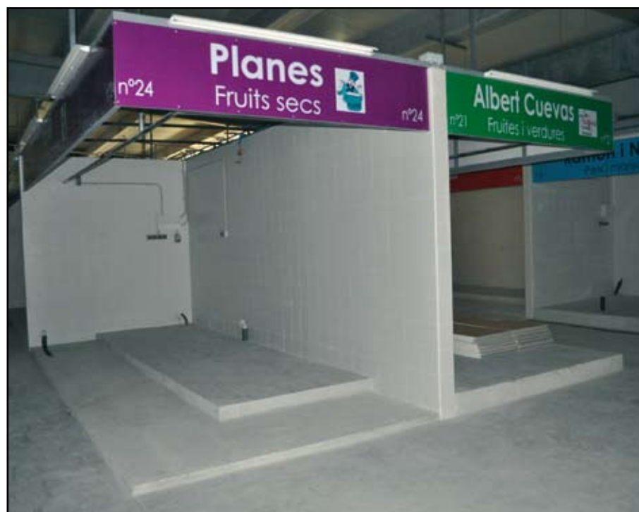
La carpa provisional del mercat ja està llesta i espera als paradistes.

Finalment, el cost del nou Mercat Municipal, que hauria d'haver estat enllestit fa prop de quatre anys, serà de 9,2 milions d'euros, "quatre milions menys del que estava previst", reconeix Martínez Cardoso. L'Ajuntament de Sant Adrià de Besòs es farà càrrec de 1,7 milions, mentre que els paradistes aportaran 2,5 milions, i Mercadona la resta, 5 milions d'euros.