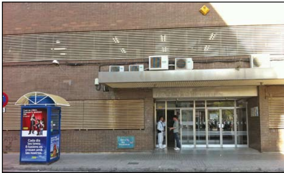
El nou Centre d'Atenció Primària de la Mina estarà llest pel 2013.