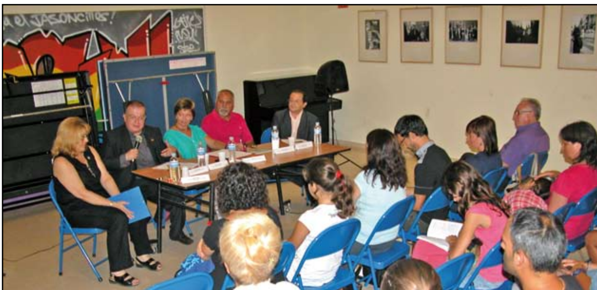
L'exposició "Sentimiento cofrade", al Centre de producció cultural i juvenil Polidor, es va inaugurar amb una taula rodona sobre el passat, el present i el futur de les dones cofrades. La mostra es pot visitar fins el proper 30 de setembre. JP

El passat 14 de setembre es va inaugurar l'exposició "Sentimiento cofrade", que es pot visitar al Centre de producció cultural i juvenil Polidor fins el proper 30 de setembre. La mostra és una iniciativa de l'Associació de Dones Cofrades de Barcelona i el Consell General de Germanats i Confraries de l'Arxidiòcesi de Barcelona, en la que ha col·laborat el CERCAT cedint imatges participants en la categoria "dona confrare" de l'IV Concurs de Fotografia Rociera pertenyents al seu fons documental. La resta