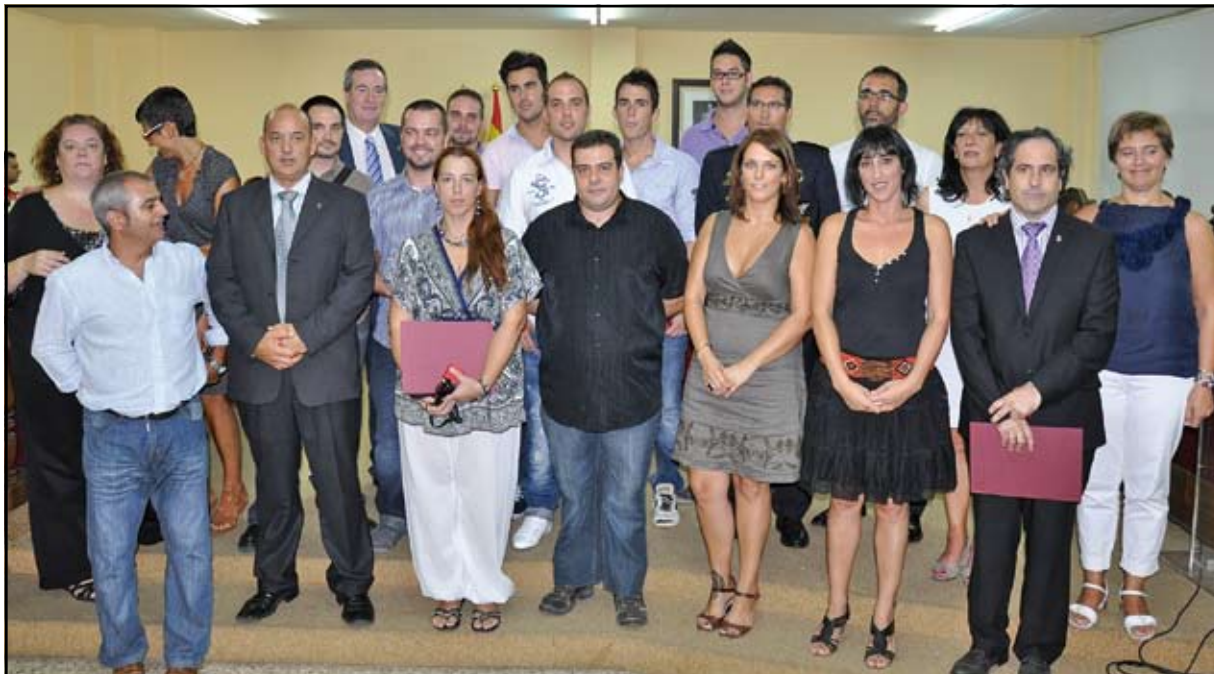
Alguns dels membres de Protecció Civil Sant Adrià que van rebre la Medalla de Plata.

La celebració de l'acte va ser a la Sala de Plens de l'Ajuntament, on gran part dels voluntaris i voluntàries, acompanyats per les seves famílies, amistats i part de la ciutadania adriana, van rebre