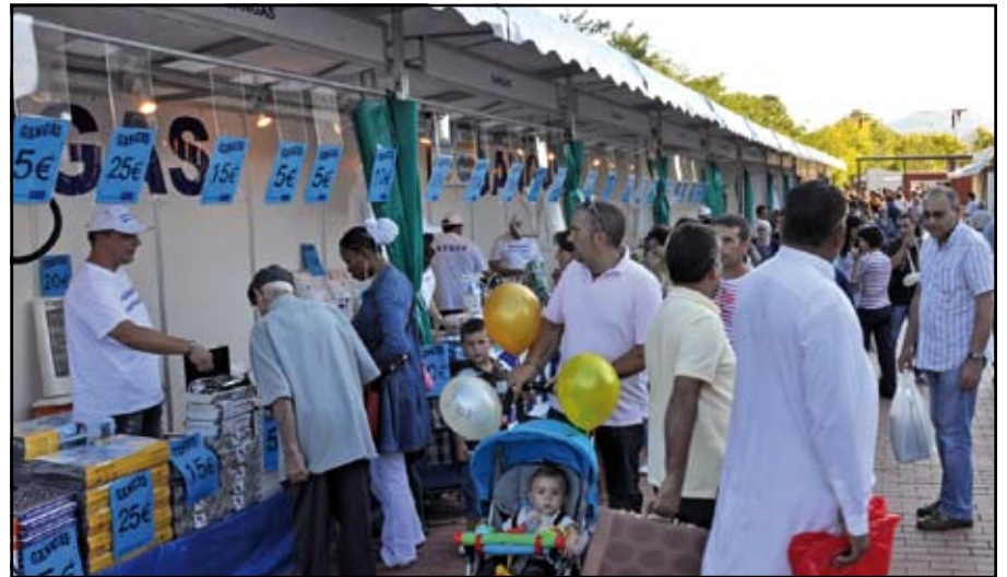
L'Expocoloma continua creixent any rere any, al Parc Europa.

El Parc d'Europa va acollir la 23a edició de la mostra.