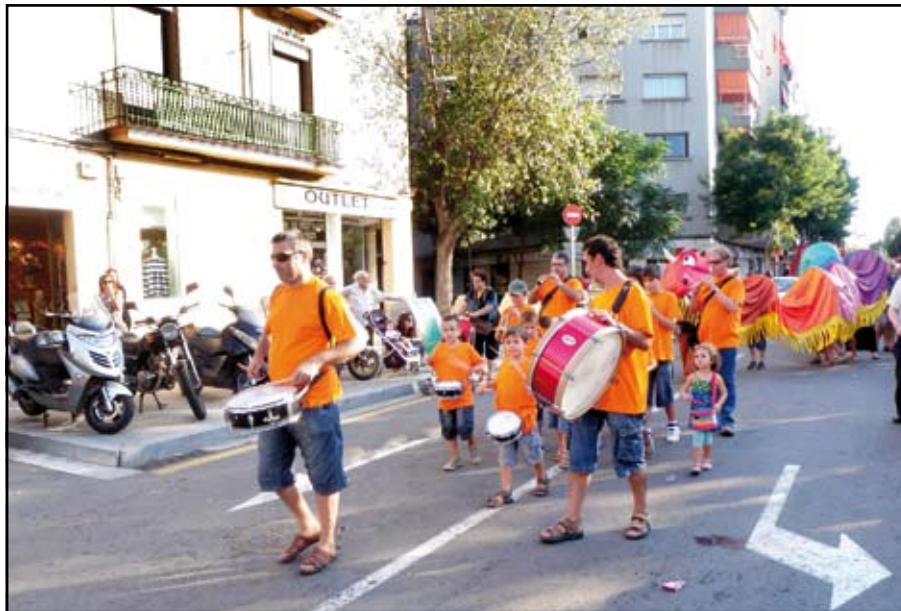
La colla de timbals i grallers del Pompeu Fabra, seguida per la Cucafera.