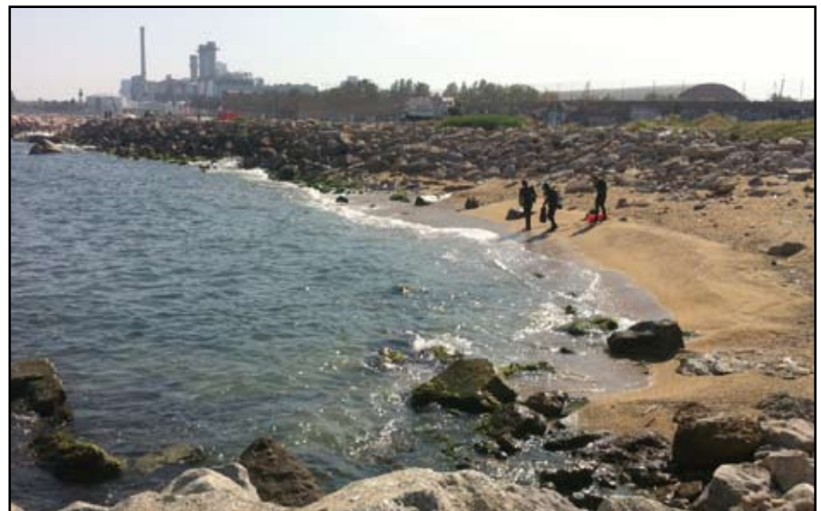
Els bussos dels Mossos d'Esquadra treballen retirant les restes dels explosius.

Davant la impossibilitat de retirar els artefactes, es va decidir detonar les tres granades que estaven actives dimarts al matí. Després de l'explosió es van recollir les peces, netejant tota la zona.