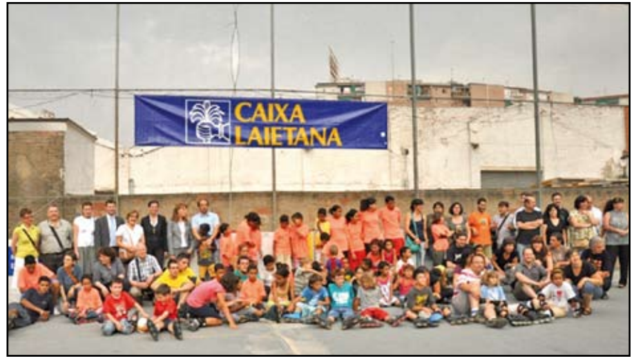
Fotografia de família del dia 12 de juliol de 2011.

Per sota, el Barcino ocupa l'última posició de descens. Unit amb Carmelo, Turó de la Peira i La Florida, que hauran de jugar la pròxima temporada a segona.