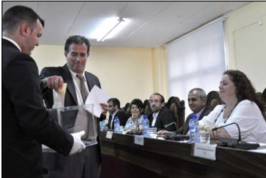
PSC i ICV-EUiA han revalidat el pacte de govern.