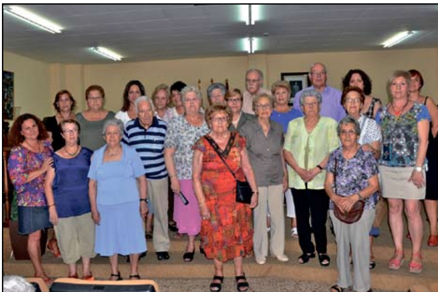
Fotografia de grup de la cloenda dels tallers de memòria de segon nivell.