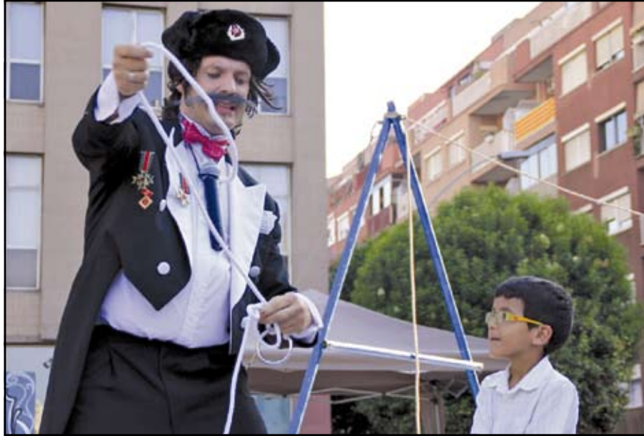
El Festival d'Art al Carrer (FAC) se celebrarà enguany durant els dies de la Festa Major. MP

El Festival d'Art de Carrer (FAC) celebrarà la seva cinquena edició durant la Festa Major de Sant Adrià, aportant així una programació completa de circ i espectacles pel jovent i els infants. Amb més de 50 propostes, el FAC es la principal novetat de la Festa Major adriana que se celebrarà del 7 a l'11 de setembre amb un pressupost d'uns 70.000 euros. A més d'aportar una programació rica en espectacles, especialment de circ però sense oblidar el grafiti, el hip-hop i altres disciplines, el festival tindrà així un ressò més acorde amb