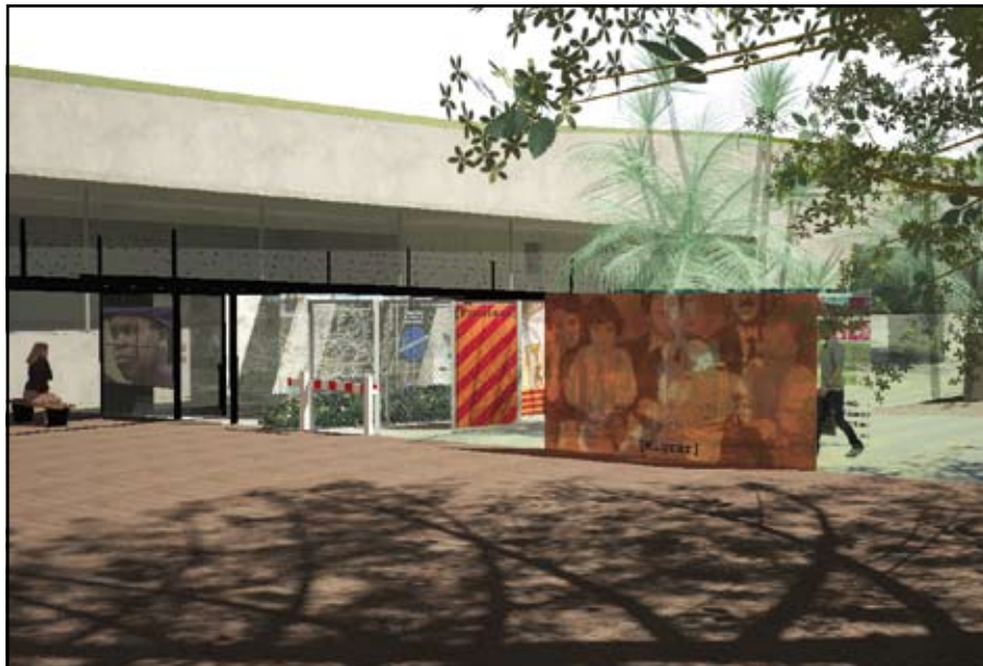
Imatge virtual del nou espai museogràfic del MhiC, amb el futur edifici del museu al fons.

envolupat per l'estudi Mizien Arquitectura amb la col·laboració de Sono, començarà a construir-se el proper