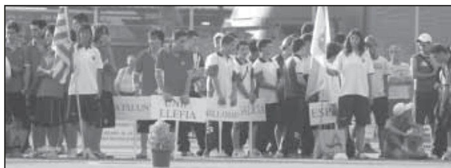
La tradicional presentación de los equipos participantes dio comienzo al torneo adriánense. JP