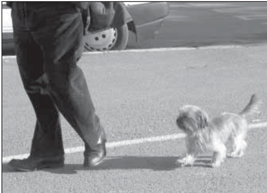
Uno de los puntos que más se controlará será la manera como se pasee al animal.

En dicho taller se dejaron bien claras las res-