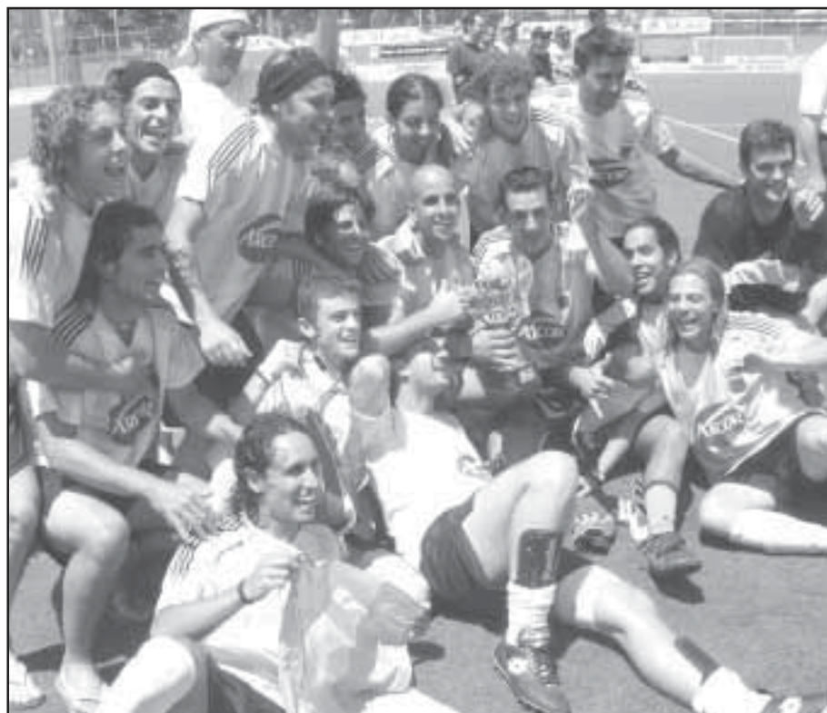
La selección Argentina se alzó con el triunfo en el Campo José Luis Ruiz Casado.