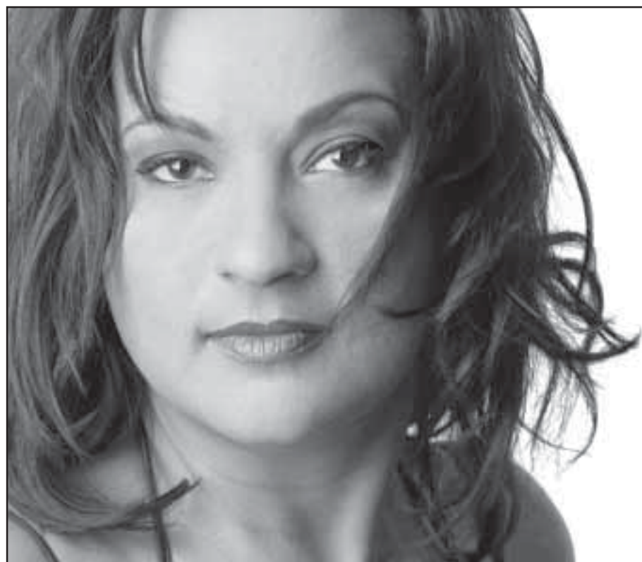
La Tana será una de las invitadas en el final de fiesta del concurso de cante de la Mina.

Todos los conciertos se iniciarán a partir de las 20.45 horas.