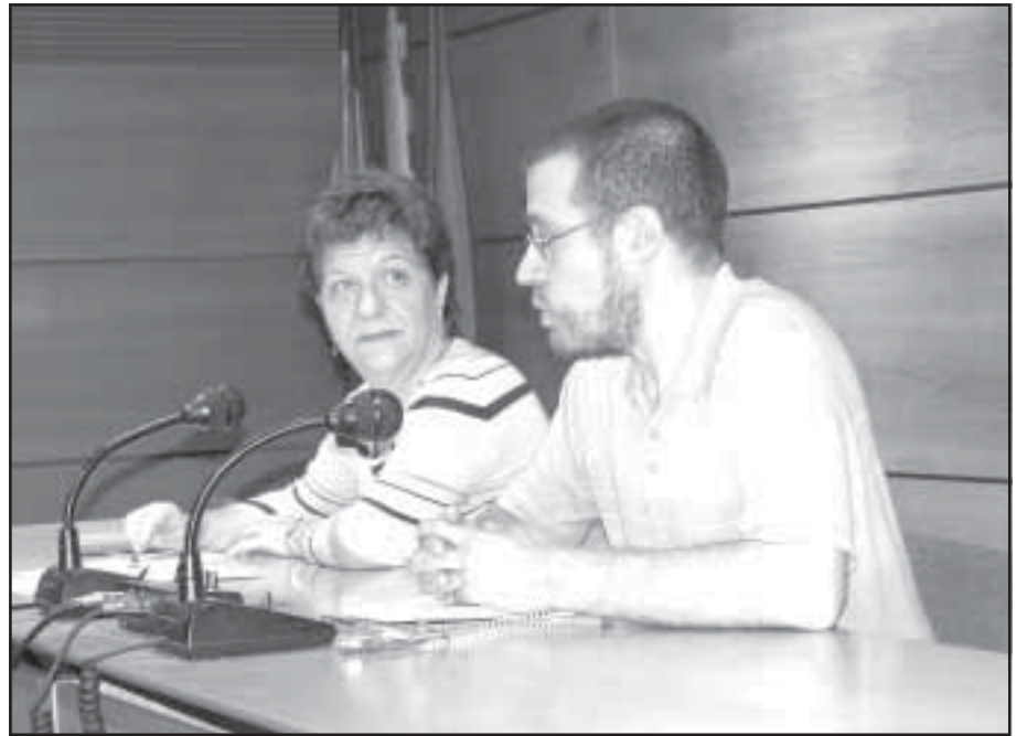
Las conferencias en la Biblioteca de Sant Adrià no consiguieron reunir a mucho público, a pesar de lo profundo y refrescante de las ideas que allí se trataron.