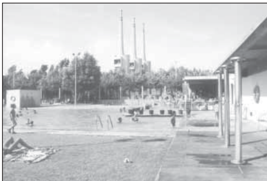
A l'estiu, l'aigua és una benedicció, però també un bé molt preciat que s'ha d'estalviar.

Hem de recordar també que el tema de l'aigua va estretament lligat a l'estiu amb el perill d'incendis forestals. En primer lloc la prevenció en qualsevol pràctica on