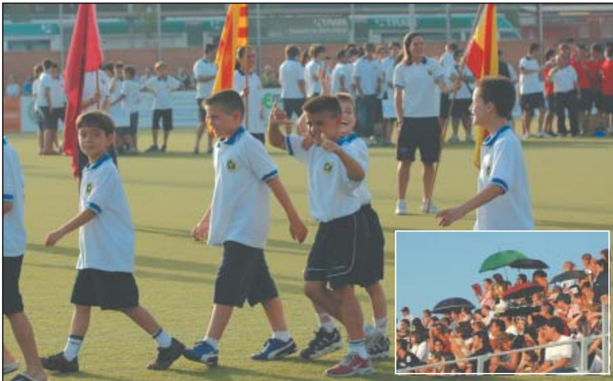
El 37 Torneo Internacional de Fútbol Base del Sant Gabriel abrió sus puertas el martes 28 de junio.

Sant Adrià. - Tras celebrarse la competición femenina el domingo 26 de junio (separada por primera vez del programa general), ayer martes se inició la competición masculina de la edición 37 del Torneo Internacional de Fútbol Base del Sant Gabriel que, por primer año, no se disputará en el campo de fútbol de la calle Ricart. Los terrenos de juegos serán el Ruiz Casado y el de la Unificación Llefia. Con equipos de Perú, A Coruña, Santander y del resto de Catalunya, la competición se llevará a cabo hasta el próximo sábado 2 de julio, cuando se jueguen las finales de las distintas categorías en las que se va a jugar. Pág. 13.