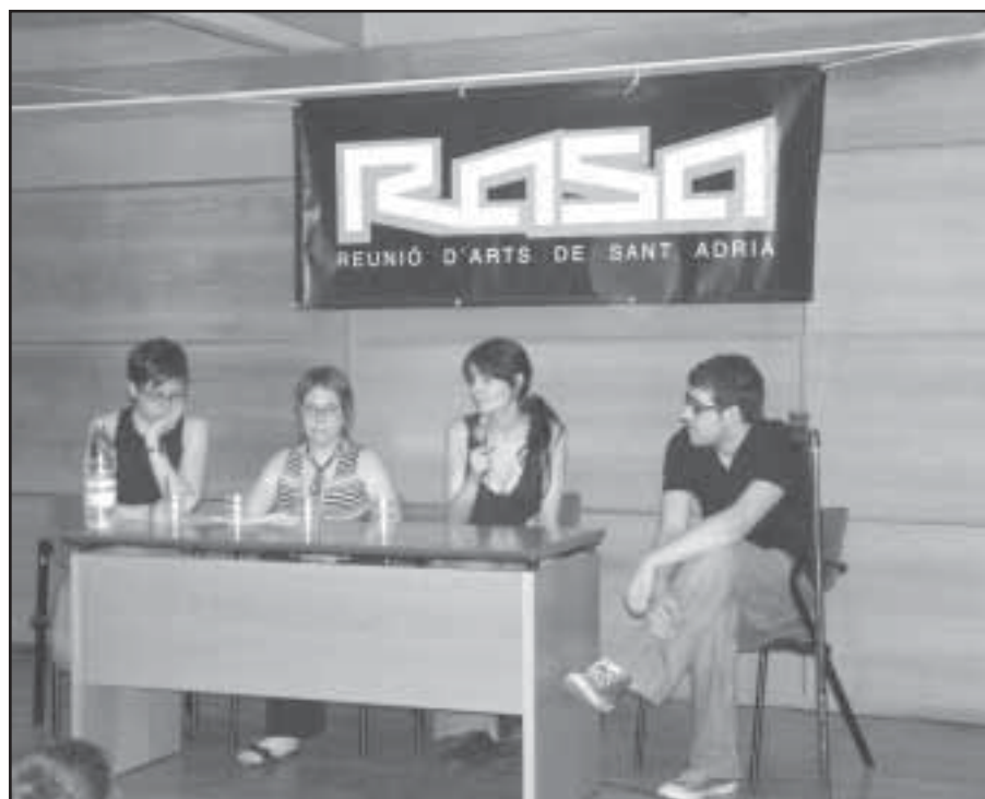
Els responsables de Reunió d'Arts de Sant Adrià, durant l'acte de presentació.

RASA compta amb el suport de l'Ajuntament i rep subvencions de la Diputació de Barcelona i la Generalitat. Aquest grup està buscant patrocinadors per fer front al seu festival.