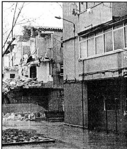
Ya se ha empezado a derrumbar los primeros edificios.

En total, en todo el barrio, se construirán casi 600 viviendas de este tipo, una cifra casi idéntica a la actual cantidad existente en el barrio.