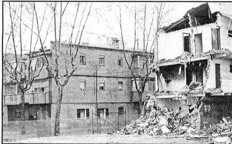
Ya han empezado los derribos de algunos edificios, y el resto est3n apuntalados.

Todos los bloques de pisos del barrio padecen aluminosis