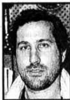
SANTOS IRRIONEPETISCO Metallista

"No, porque el Casc Antic no es una zona comercial, hay pocas tiendas, y las que hay están junto a talleres e industrias. No es una zona adecuada para que la gente venga a pasearse."