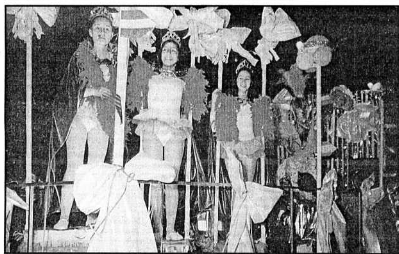
Un aspecto de la rúa que recorrió las calles de la ciudad el sábadu.

Gracias al cambio de local, esta entidad puede optar por ser la sede de las finales de ascenso estatales, si consigue clasificarse para disputarlas. Los representantes del club se muestran confiados en que lo lograrán. Página 12